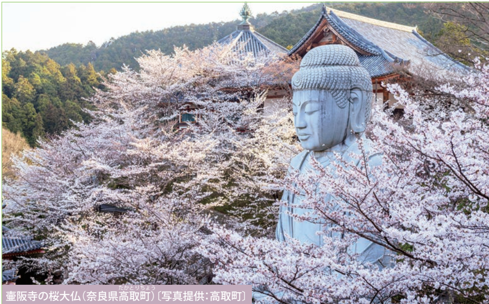
壺阪寺の桜大仏(奈良県高取町)