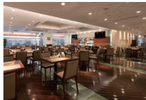
レストラン「ペルラン」

全国町村会館には、 会議室・宴会場のほかに、 ふたつのレストランもございます。 お気軽にお立ち寄りください。