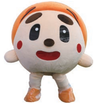
小清水町役場じゃがいもでんぶん課主事。7月28日生まれの子。「でんぶんだんご」作りが得意で、好物ももちろん「でんぶんだんご」。時々、「でんぶんだんご」を焼くときに使うヘラを手に持っている。