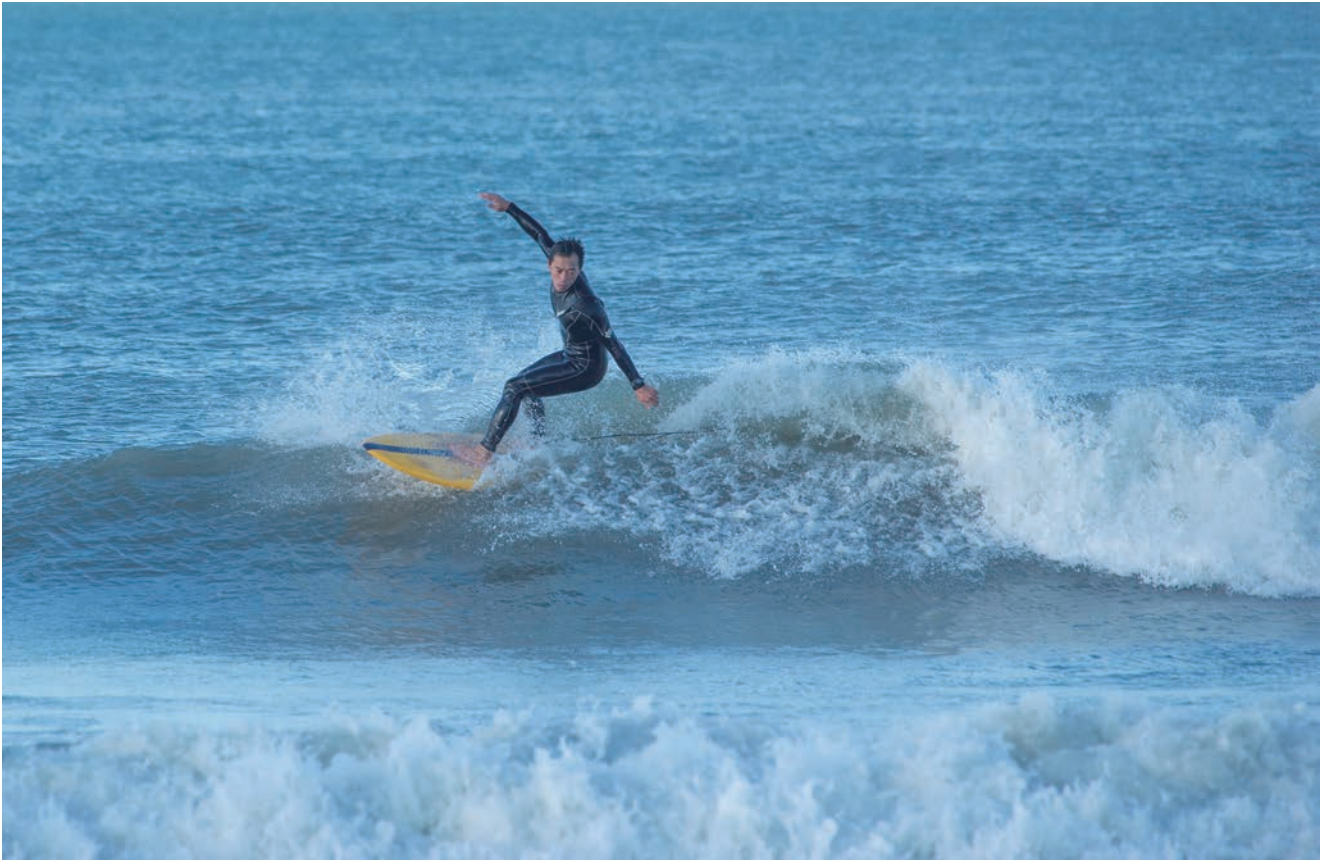
▲浜厚真海岸に集うサーファー