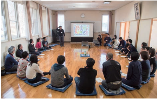
▲ローカルベンチャースクール