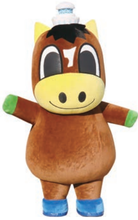
1月7日生まれの子。どのような環境にも対応するたくましさを持っている。大きなお腹には懐かしさがたくさん詰まっている(はず)。尻屋崎の学生が大好き。趣味はかけっこ。「シロタンキンポウゲ」は嫌いなので、食べない。

青森県最北東端の村・東通村のイメージキャラクター「かんだちくん」は、1995年に村のイベントイメージキャラクターとして公募によって誕生しました。尻屋崎の「寒立馬(かんだちめ)」をモチーフにして、頭のてつぺんの「尻屋崎灯台」がチャームポイントです。2018年には、クラウドファンディングを活用した、実体化、プロジェクトにより、パワーアップした「かんだちくん」として登場し、村の特産品や観光、郷土芸能をPRしながら、村の魅力を全国に発信しています。2026年7月には、白亜の灯台「尻屋崎灯台」を舞台に、「灯台ワールドサミット in 東通」が開催されます。国内外の灯台ファンが集つこの特別なイベントを「かんだちくん」も全力で盛り上げます。