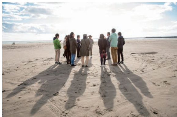
▲厚真町に集う挑戦者たち