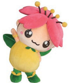
7月7日生まれ。桜の妖精と柚子の妖精の間に生まれた花の妖精。いつも笑顔で、明るく前向き。特技は誰とでもすぐ仲良しになれること。柚子風味の食べ物や飲み物が大好き。素早い動きはちょっと苦手。

「はなみちゃん」は、「船岡城址公園の桜」や「白石川堤一目千本桜」で有名な「花のまち柴田」の公式キャラクターです。頭には町の花「桜」をあしらった、体は町の特産品「柚子」でできていて、2012年7月7日に「はなみちゃん」が大好きな「船岡城址公園」でお披露目されました。「船岡城址公園」では、桜まつり(4月)や紫陽花まつり(6月~7月)、曼珠沙華まつり(9月~10月)、ファンタジーイルミネーション(12月)、季節の花の展示即売会など、年間を通して楽しむ、「はなみちゃん」もイベントの際には、応援にかけつけ、町民や観光客との交流を楽しんでいます。これからも「はなみちゃん」は、四季折々に花で彩られる「花のまち柴田」をPRしていきますので、ぜひ「はなみちゃん」に会いに来てほしいです。