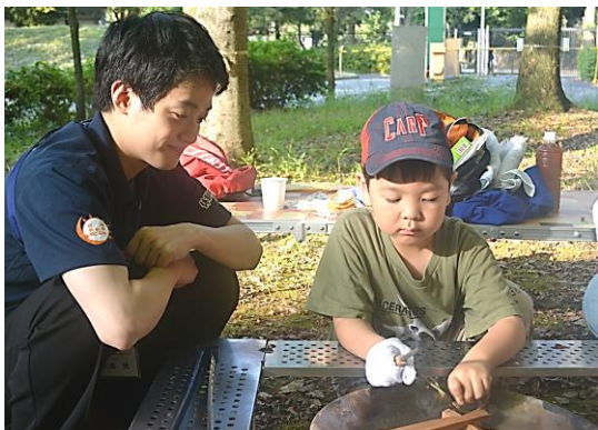
<教育事業の補助の様子>