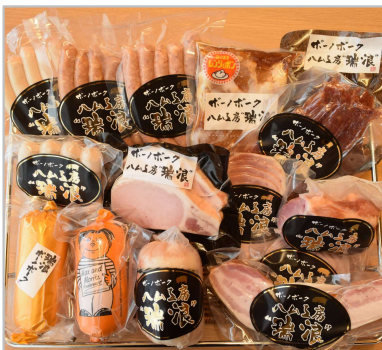
特産品の豚肉、野菜を使った食肉加工品の開発