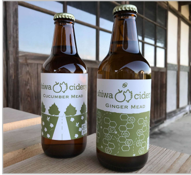
特産のきゅうりと地元の良質な水を使ったミード酒(蜂蜜酒)の開発