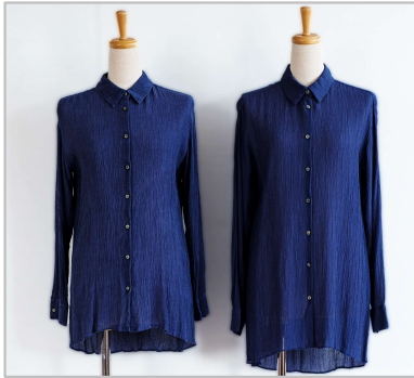
環境に優しく家庭洗濯可能な植物系再生繊維の開発