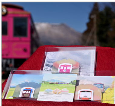
廃棄されてしまう特産牛の牛脂を活用した石鱈の開発