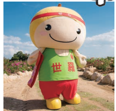
10月1日生まれ。10歳の男の子。好きな食べ物は、世羅米のおにぎりとお世羅梨。好きな飲み物はランニングウォーター。将来の夢は、「世羅高校陸上競技部に入部して活躍すること」。