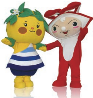
つきみん(左)はかわいらしい女の子、ガネッタ(右)は元気な男の子。テレビに出演したり、小学校や幼稚園・保育園の行事に参加したりするので、子どもに大人気。

2011年に誕生したキャラクターで、名前は公募により決まりました。『月の引力が見える町 太良町』のシンボルマークをイメージし、特産品のみかんの花冠を飾った女の子「つきみん」は、町在りの小学生が名付け親です。そして、太良町の海の幸の代表・竹崎カニをイメージした男の子「ガネッタ」の名付け親は、太良町出身で岐阜県可児市在住の方でした。不思議な名前にも思える「ガネッタ」ですが、地元ではカニのことを「ガネ」と呼ぶことから由来しているもの。2015年には、町合併60周年記念事業の一環で、それぞれを主人公とした絵本を制作しました。有明海や太良町を舞台に、誕生秘話や冒険が描かれています。また、「SAGA2024 国スポ・全障スポ」の太良町ロゴに、「つきみん」が描かれるなど、太良町を象徴する存在になっています。