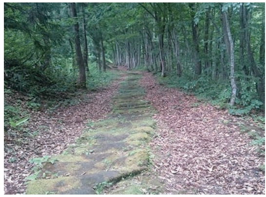
山形県小国町・黒沢峠の敷石道

山形県小国町の町史には、上杉家文書である『邑鏡』（文禄4（1595）年）からとった小国町の集落地図が記載されている。そこには現在100余ある小国町の集落はほとんどが記されている。巨大な武家集団であった上杉家が、米沢周辺の農山村に武士を分散させたともいわれるが、地図上に集落名と戸数が明記されていることからみても、4百数十年前にはこれらの集落経営がすでになされていたことが分かる。越後から米沢に至る町内の黒沢峠も、地図に明記されている。この峠の敷石道は1mも土に覆われていたが、黒沢集落の有志により、40年前、5年をかけて掘り起こし復元された。イサベラ・バードも通ったこの峠に光を当てようとする住民の活動もある。これらはほんの一例であるが、日本の集落は永い歴史的蓄積をもち、地域固有の文化を集落単位で育んできた。それぞれの集落にはかつての