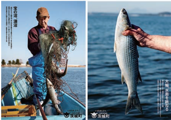
▲APAアワード入選 茨城町PRポスター