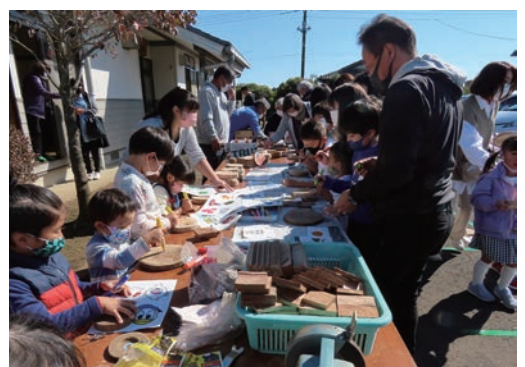
▲ふるさと元気づくり推進事業による三世代交流会

され、世界の酒沼に代表される水と緑の豊かな自然が息づいています。また、高速道路や国・県道の整備が進むなど、道路条件にも恵まれ、農・商・工の産業がバランス良く発達し、町民の気質は人情味にあふれています。こうした当町の特長・資源を最大限に生かしながら、「住むことを誇れるまちづくり」、「人が行き交うまちづくり」、「協働のまちづくり」を進め、子どもも高齢者も、住む人も訪れる人も、当町にかかわるすべての人が笑顔でふれあい、交流し、元気になる、夢と希望に満ちあふれたまちをみんなでつくり上げ、未来へつないでいくという想いを込めた『三世代が共に輝く元氣交流空間 夢と希望を未来へつなぐまち』を目指し、町民との協働によるまちづくりを進めています。