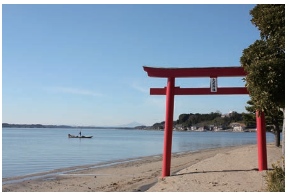
▲水戸八景の1つ名勝「広浦」