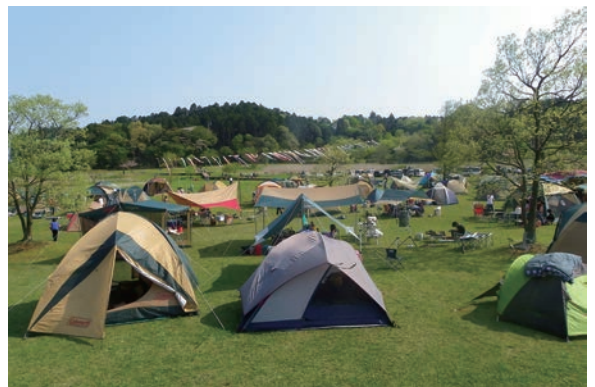
▲人気のレジャースポットである「酒沼自然公園キャンプ場」

親沢は、砂浜と松林が広がる風情ある公園で、キャンプやバーベキューのほか、釣りなども楽しむことができます。園内には、「親沢の一つ松」を詠んだ水戸黄門こと徳川光圀公の句碑があります。