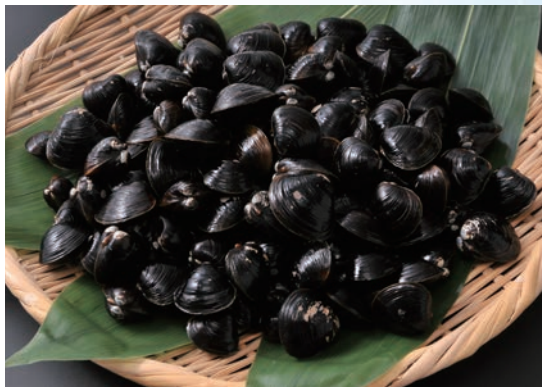
▲大粒で肉厚、濃厚な味わいの「潟沼産ヤマトシジミ」

当町は、豊かな水や平坦で肥沃な土地、農耕に適した気候条件を生かし、古くから農業を基幹産業として発展してきました。現在、「地理的表示(GI)保護制度」に登録された「飯沼栗」をはじめ、米やメロン、イチゴ、トマトなど、多様な農産物が生産されています。畜産業も盛んで、茨城県のブランド牛である常陸牛などが生産されています。また、潟沼には、ハゼやウナギなどが生息しており、特にヤマトシジミ