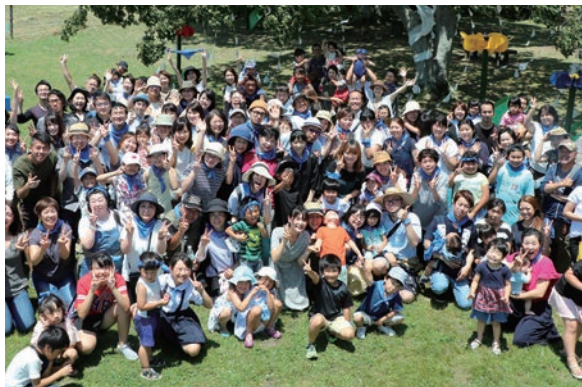
▲プロモーションビデオ撮影に参加された皆さん

員を中心に町内外から約2000人の方が参加されました。なお、本ビデオは、町のホームページやYouTubeで