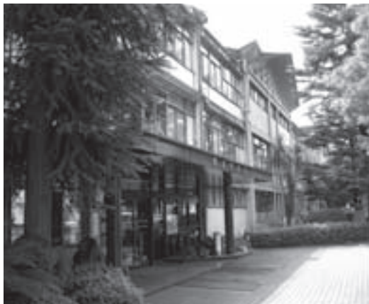
▷レーモンド設計事務所が設計した鬼北町庁舎

高齢者が「誇り」や「生きがい」を持ち、輝いて生きていける町づくりを進めていきたいと考えています。