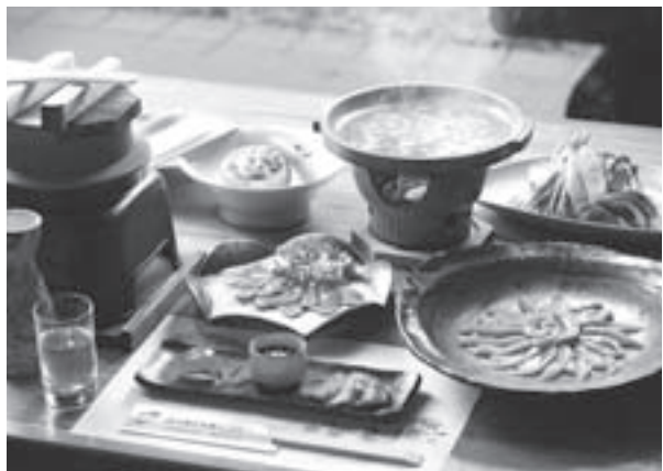
◁「古(いにしえ)の味を食卓へ」 鬼北熟成きじを「賞味あれ

り一層細胞破壊を進めるといことが判明しました。また解凍時には、旨味成分を含む細胞内の諸成分がドリップ(多量の水分)となっており、しまい、味も鮮度も落ちてしまうことも解かりました。熟成技術で旨味成分をたっぷり含んだきじ肉に仕上げても、商品化するためには新しい凍結法の開発が急務となりました。様々な実験の結果、熟成後マイナス30度以下のアルコール液にきじ肉を浸す「瞬間急速凍結技術」を開発いたしました。急速に内部まで凍結することで、細胞内に生じた微結晶