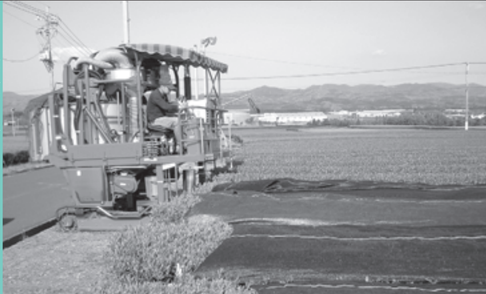
一番茶の収穫 (鹿兒島県)