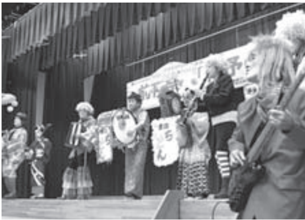
▶大人気の「愛治ちんどんクラブ」

そんな距離ではありますが、少しでも復興のお役に立てるならとイベント参加に向け準備を進めております。今回のイベントへの参加は、高齢者になっても、まだまだ社会のお役にたてるという、人間としての「誇り」の回復ではないかと思っています。