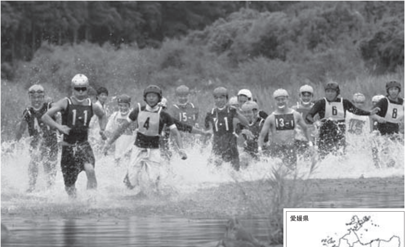
△四万十川最大支流「広見川」での川上り駅伝