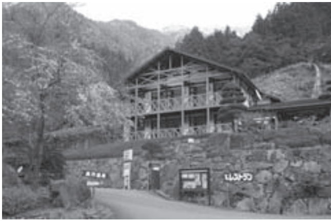
▷温泉が楽しめる成川溪谷休養センター

キャンプ場を完備しました。これにより四季を通じて遊山客が多く訪れるようになりました。隣接する高月温泉は、ラジウムと硫酸の混合泉で万病に効果があると云われており、大浴場からはガラス越しに移りゆく四季折々の溪谷美を眺めることができます。温泉とこるさと料理さらに温泉のあるキャンプ場としてアウトドアやグリーンツーリズムなど「癒し型レジャースポット」として人気を博しています。