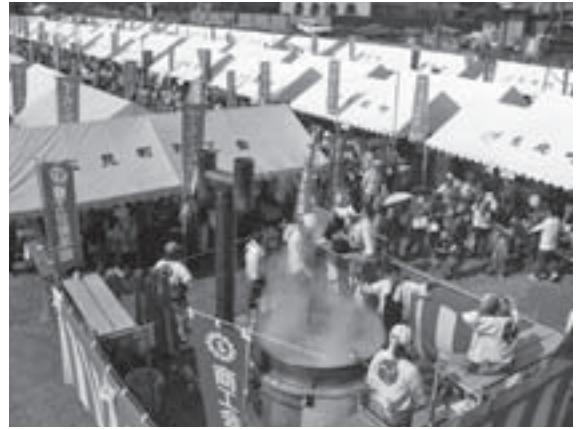
◀最大イベント「でちこんか」でのジャンボきじ鍋(手前)

「じ」を自信を持って提供させていただいておりますので、ぜひご賞味いただきたいと思えます。