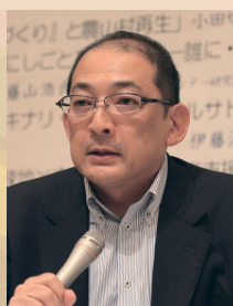
明治大学農学部 教授