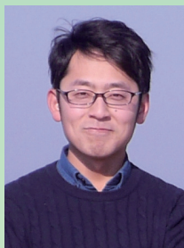
合同会社とびしま 副代表