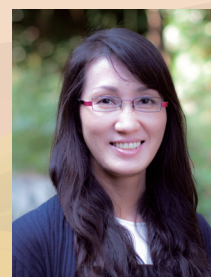
有限会社咲楽 代表取締役