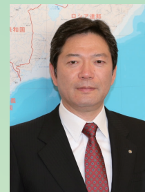
全国町村会 事務総長