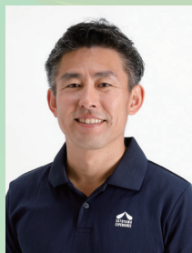
株式会社美ら地球 CEO