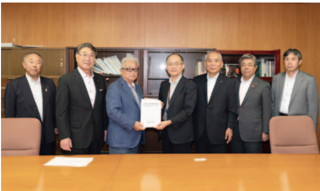
厚生労働省 蒲原厚生労働事務次官 (中央)