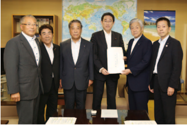
自由民主党 岸田政調会長 (右から3人目)