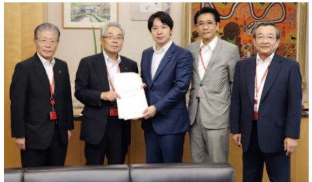
総務省 小倉総務大臣政務官 (中央)