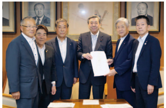
自由民主党 林幹事長代理 (右から3人目)

要請活動は、自民党、総務省、国土交通省、厚生労働省、農林水産省などに対し、4班に分かれて実施、要望事項全般の実現方を訴えた。 なお、同じく理事会で決議した「学校や保育園等の公共施設における危険なブロック塀等の撤去・改修に関する緊急要望」及び「青少年自然体験活動等の推進に関する法律」の早期制定に関する要望についても、併せて関係各所に対し、その実現方について要請活動を行った。