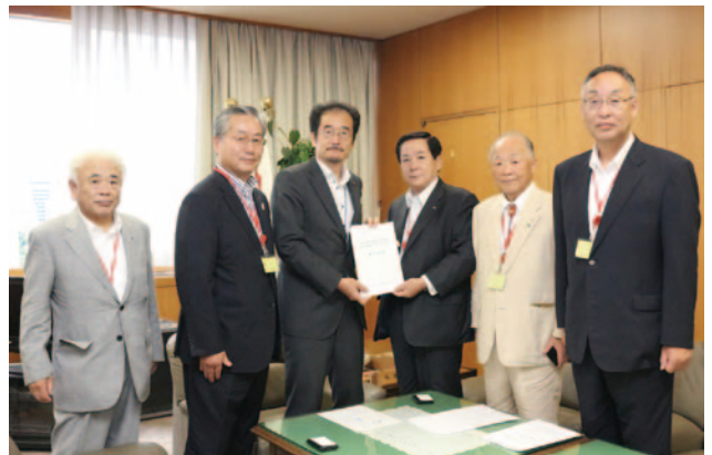
農林水産省 長谷水産庁長官 (左から3人目)