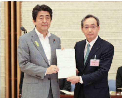
▲市川会長(右)に諮問する安倍総理大臣(左)

顕在化する諸課題に対応する観点から、圏域における地方公共団体の協力関係、公・共・私のベストミックスその他の必要な地方行政体制のあり方について、調査審議を求めるとの諮問が市川会長に対して行われた。地方制度調査会では今後、総務省の「自治体戦略2040構想研究会」が今般まとめた報告書において示さ