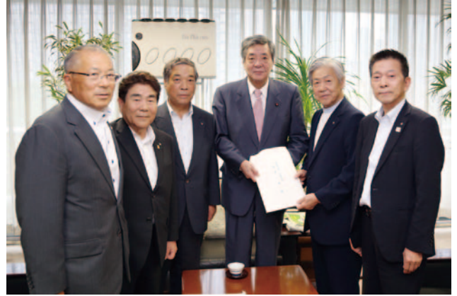
自由民主党 竹下総務会長 (右から3人目)