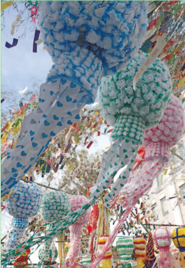
町中をにぎやかに彩る小川和紙(埼玉県小川町提供・小川町七夕まつり)