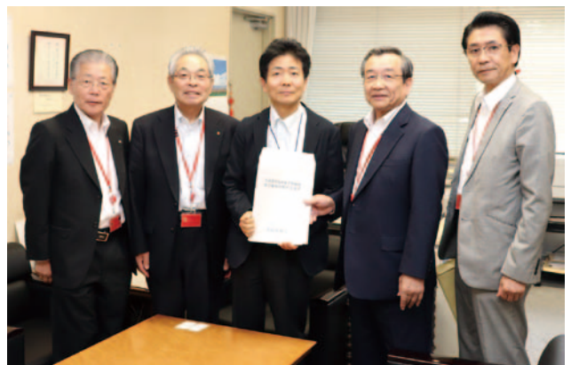
国土交通省 石川道路局長 (中央)