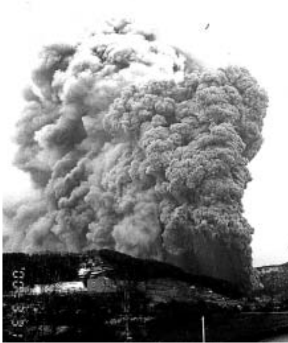
西側麓から突如として噴煙を上げた有珠山

ついでには、洞爺湖周辺の景観を阻害する廃屋や看板の撤去、空き店舗対策など美化活動を展開する。「おもてなしの心」としては、滞在期間中に不便を感じさせないための取組みとして、