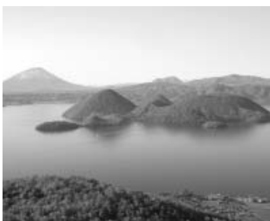
自然豊かな洞爺湖