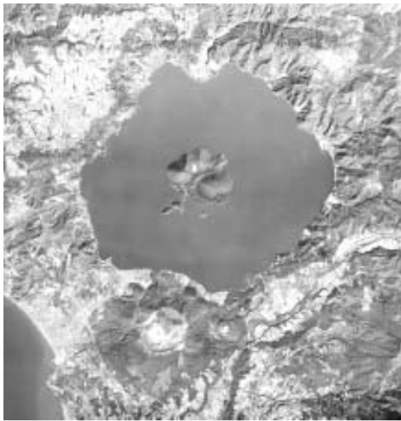
上空から見た洞爺湖

開催決定から1年数ヶ月の中での準備であり、当初は手探りの状況での取組みでした。前回、日本で開催された2000年九州・沖縄サミットの時、当町は有珠山噴火災害での避難生活の中にあり、復旧・復興への日々の中にありました。また、平成18年3月27日に市町村合併により、新町洞爺湖町(旧虻田町・洞爺村)が誕生するなどめまぐるしく環境変化の時を過ごしている中での「北海道洞爺湖サミット」開催決定でありました。このことは、洞爺湖町にとって歴史的に残る大きな事業でも