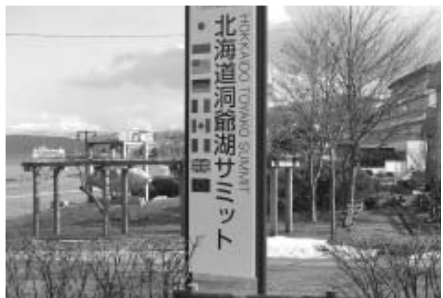
サミット関係者を歓迎する看板

1、下水事業の展開として、洞爺湖温泉街では100%の普及率で、すでに下水道整備が完了しており、30年前から湖水の汚濁防止を展開して現在に至っております。