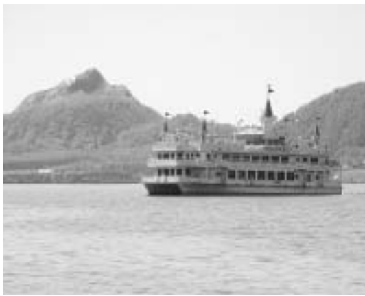
客船エスポワールと昭和新山

サミット開催を契機として、民間活力を大いに期待しながら歓迎準備を進めております。