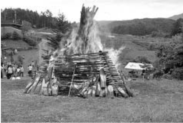
フィンランド夏至祭