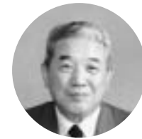
徳島県町村会長 海陽町長