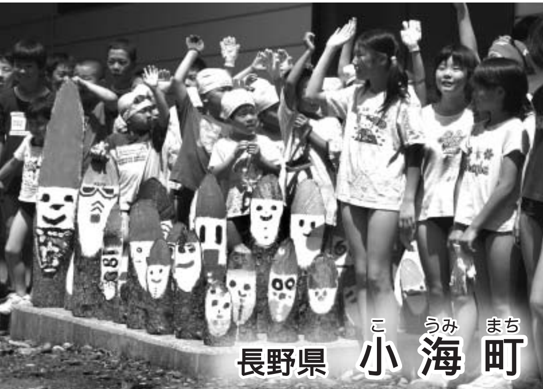
小学校でのペティリッツア作り

平成6年12月、地域づくりアドバイザー事業により町づくりに関心のある有志が集結、翌年の平成7年4月に「こつみ塾」が正式に