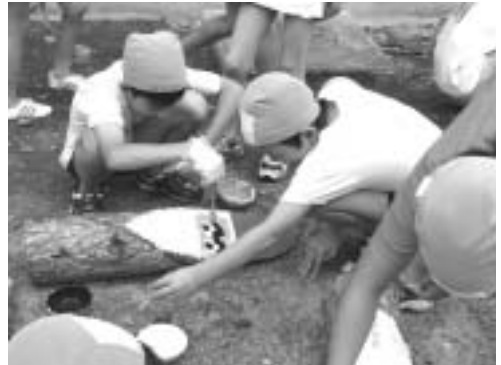
プティリツア作りに励む児童

プティリツアとは、小海町松原高原に棲むと言われている森の妖精のことです。250年以上も生きられるという彼等は、現在人間が持っている5つの感覚「視覚・聴覚・臭覚・味覚・触覚」の他に、6番目の感覚を持っていると言われて 彼等が最も嫌う【自己エネルギー】、自分さえよければ・・・、と 思う心を敏感に察知する感覚を持つているため、豊かな自然と暖かい心を持った人間の住む土地にしか生きられない」と言われています。その為、すばらしい自然環境と暖かい心を持った人々がいる小海町に棲みついたのではないのでしょうか。 プティリツア普及策の一つとして、からまつの間伐材にプティリツアの顔を描いて街のいたる所に置き、このプティリツアの精神をアピールしています。この間伐材は、森林ボランティアの方々が、からまつ林の間伐等を行い山の整備をしていただいたものです。その間伐材が、プティリツ