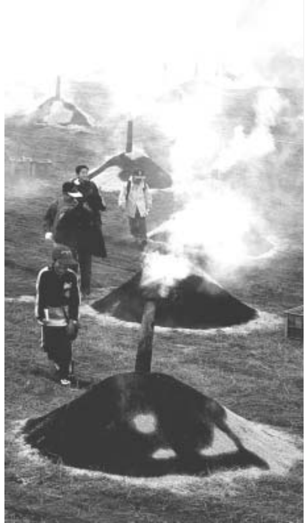
いも祭りにて(千葉県・栗源)

最近全人類の問題として取り上げられる地球温暖化問題・環境問題でも、日本の公害対策と省エネ技術開発は「ベスト・プラクティス」だ。お隣中国の経済の急成長は、どうし