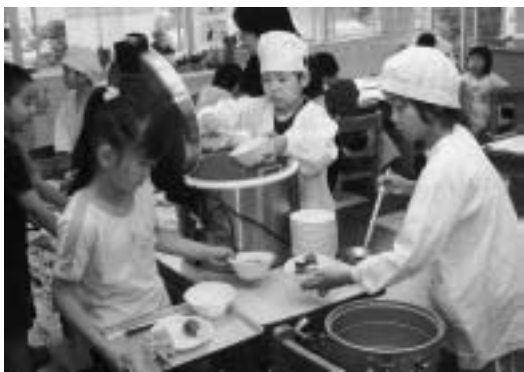
保温ジャーで炊きたてごはん