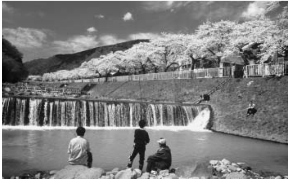
早川と桜