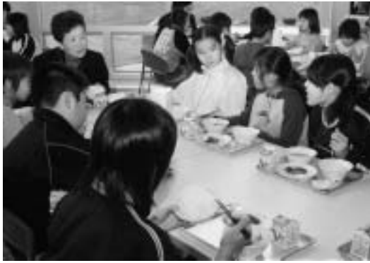
学校給食応援が食材を提供

また、伝説に満ちた津軽富士見湖の優美な湖面に架かる日本一長いきの橋「鶴の舞橋」が、平成6年に完成しました。自然に配慮し、樹齢150年以上の県産ヒバ1等材を用いて造られた三連太鼓橋は全長300mで、岩木山を背景に鶴の舞橋を湖面に映す眺望は、県内でも屈指の観光スポット