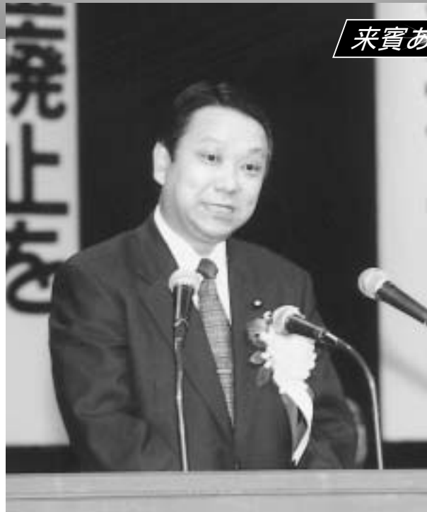
内閣総理大臣代理 七 条 明 内閣府副大臣