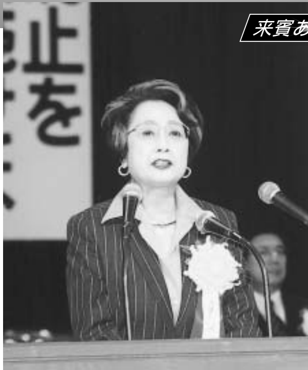
参議院議長 扇 千景