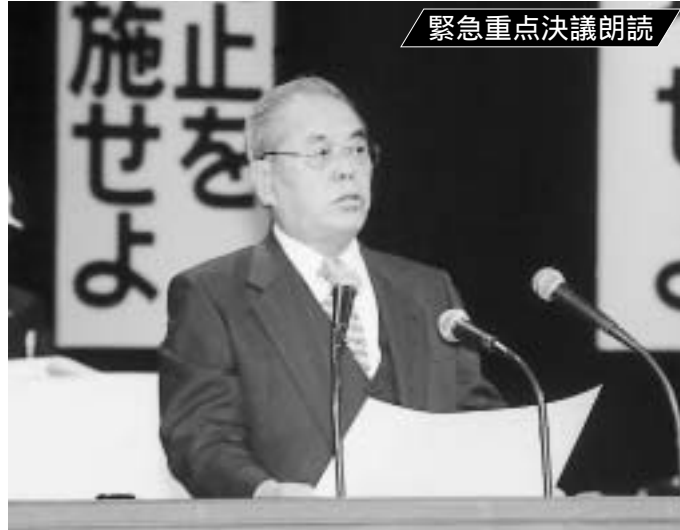
全国町村会副会長 京都府園部町長