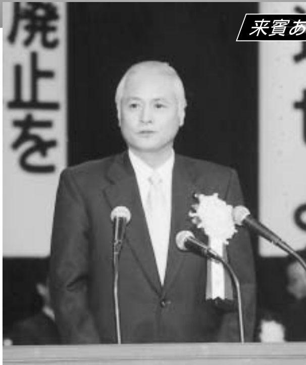
総務大臣代理 山本 公一 総務副大臣