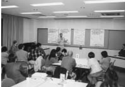
町のアイデンティティを考えるワークショップ