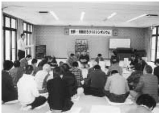
生野・景観シンポジウム…ひな祭トーク

住民の中には行政に対する信頼感や親近感、まちづくり活動への確かな参加意識が生まれ、職員にとっては住民の立場や考え方の理解を深める場となり、政策形成能力や業務遂行能力の向上にもつながっているということができます。そして、グループの役場職員は各課の職員から構成されているので、役場の縦割りの組織を超えた横軸の連携が生まれるきっかけにもなっているのではないかと思っています。