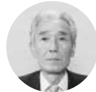
県 長 嗣 卓 村 直 岐 日 口 かす 春 樋