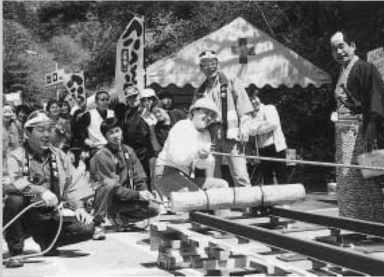
生野銀山へいくろう祭トロッコ力自慢選手権