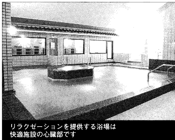
リラクゼーションを提供する浴場は快適施設の心臓部です

★自慢のふるさとなをつくりませんか?! トロン温泉地域が誇れる自慢の施設に自治体も、住民も満足しています