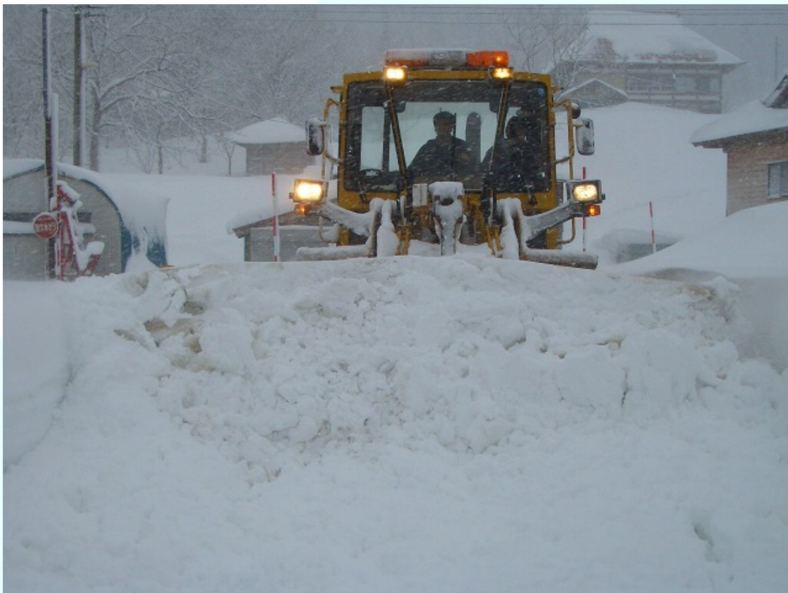
福島県只見町 早朝の除雪作業では間に合わないため、昼間も出動。