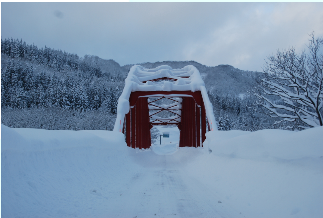
秋田県東成瀬村 積雪により狭矮化した国道にかかる橋。