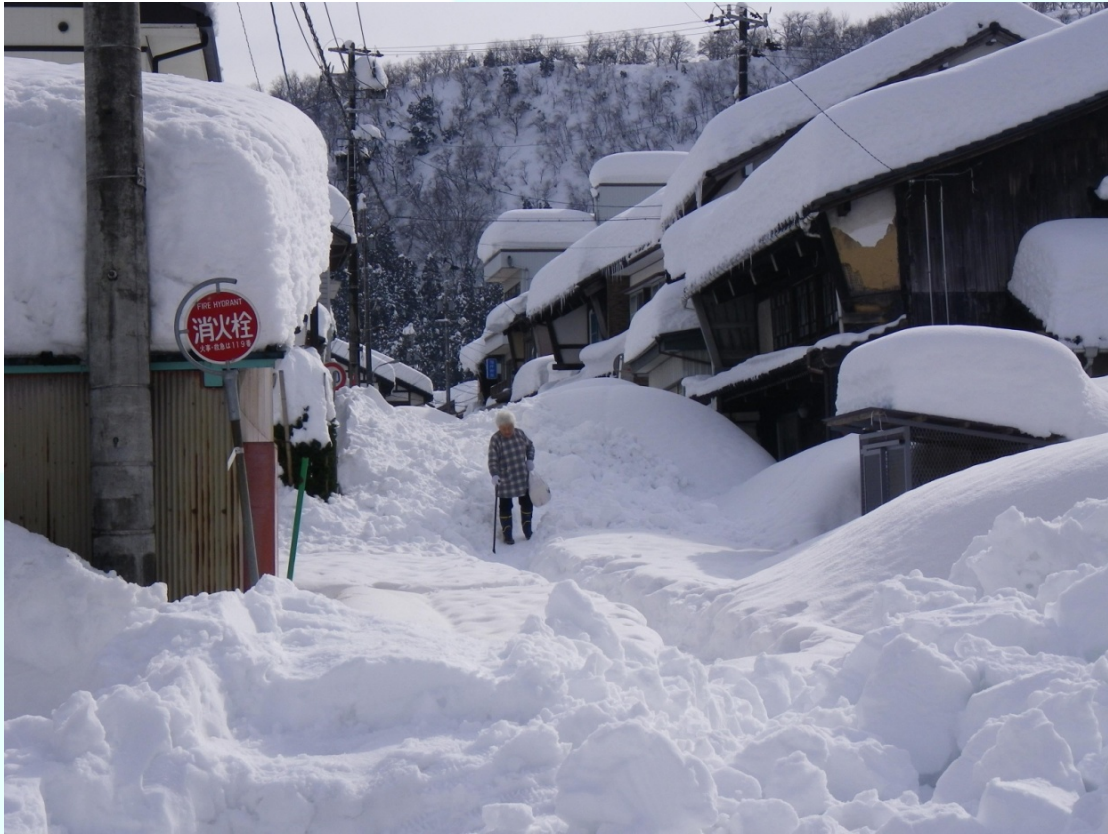
福井県 南越前町 今庄地区中心部 足元に気をつけながら歩く住民