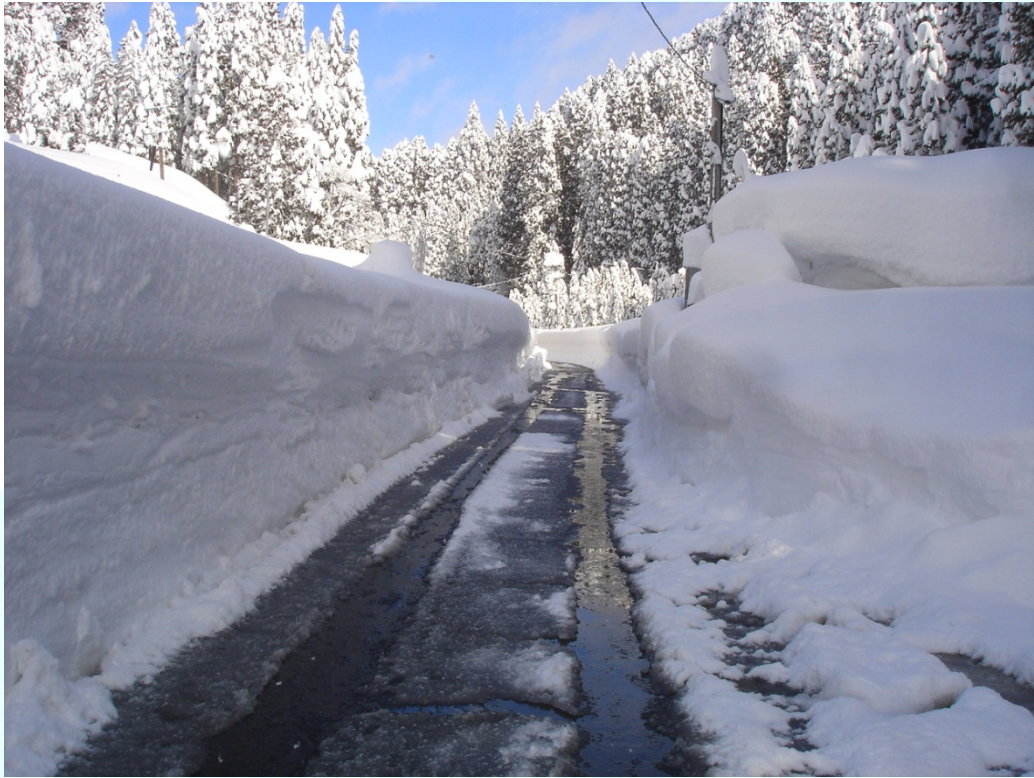
福井県池田町 道幅が狭く、1車線しか確保できない。(町道広瀬谷口線 金見谷地係)