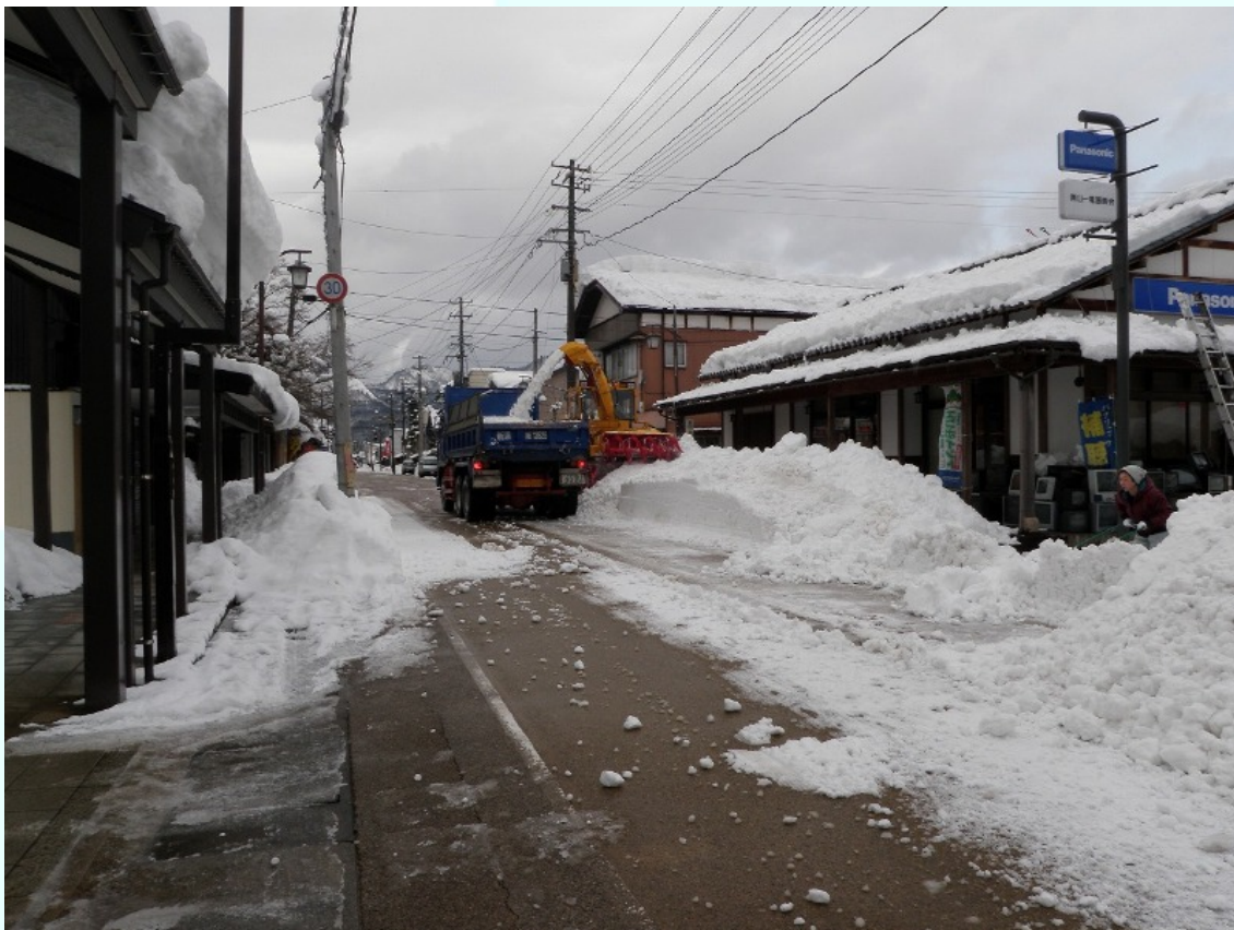
新潟県阿賀町（旧津川町）：中心部の一斉除雪の状況 ※3日間に渡り通行止めにして実施