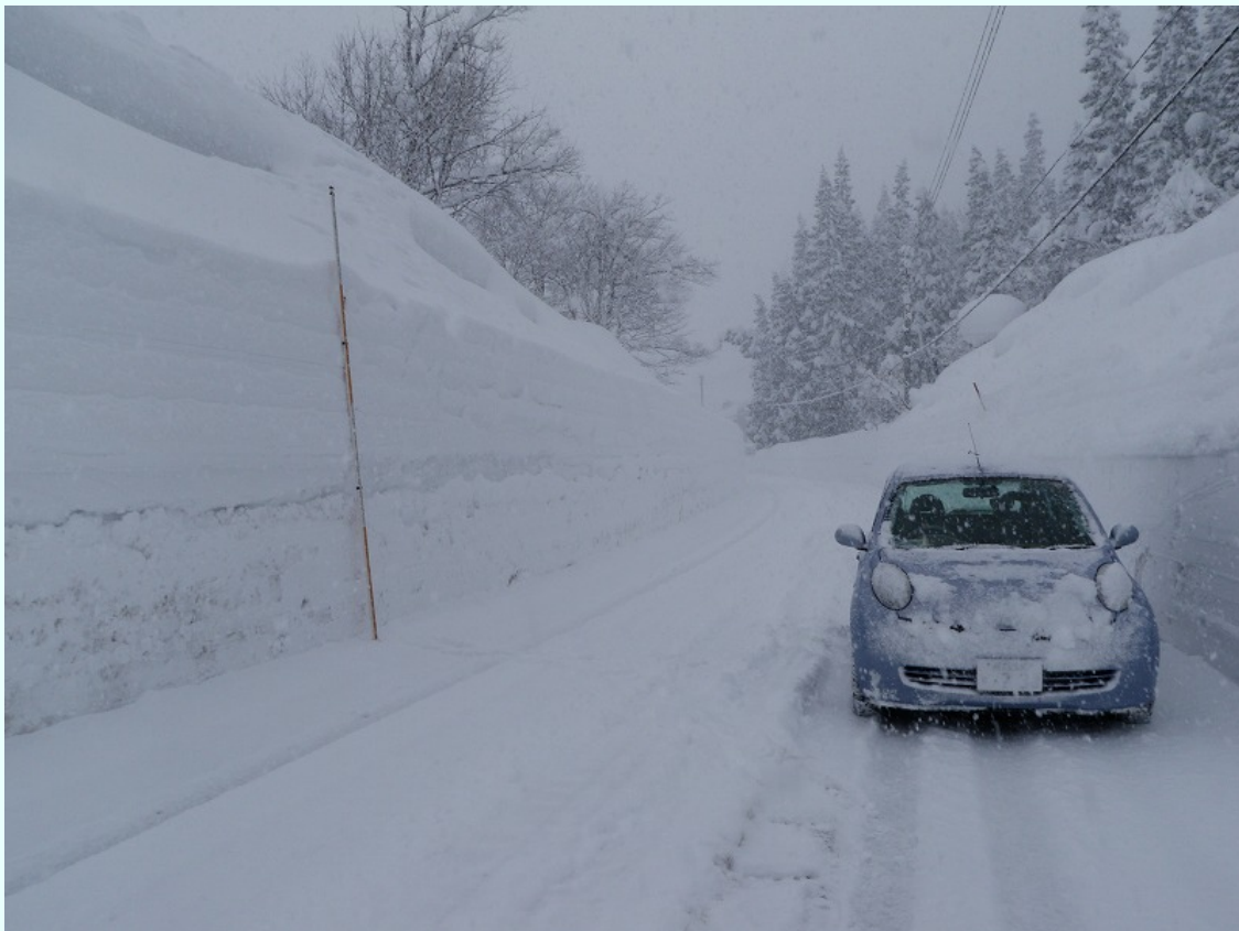
新潟県阿賀町（旧上川村）県道室谷一津川線：両側の雪壁で道幅が狭くなる。