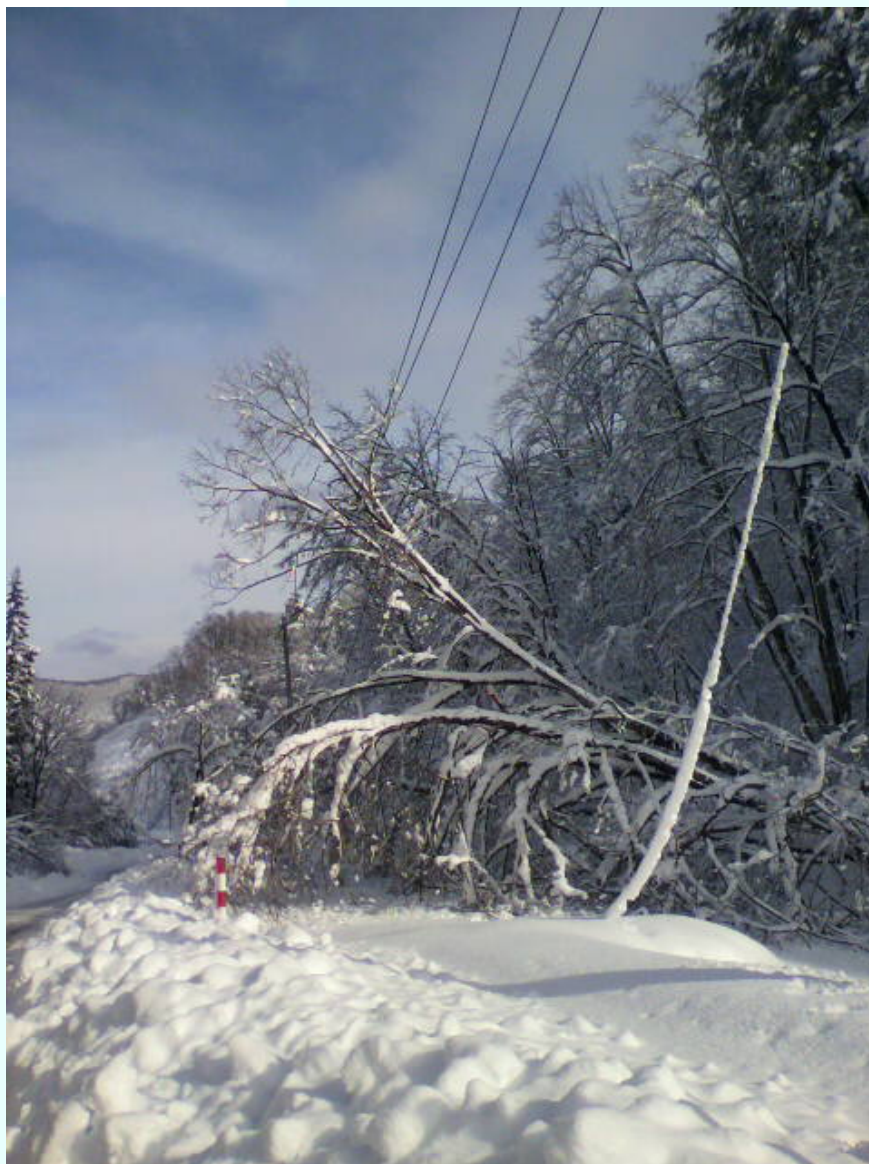
岩手県一戸町 2010.12.31 雪の重みで倒れた樹木が電線に絡まった状況その3