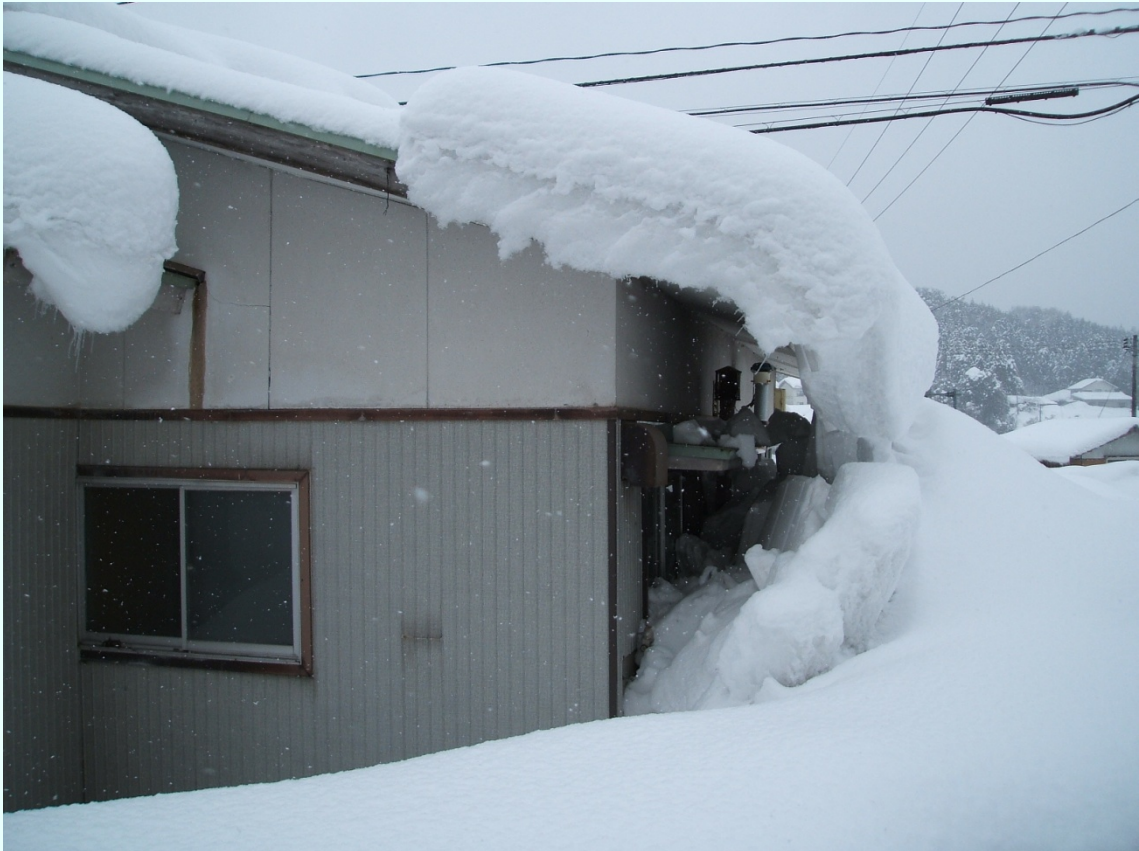
島根県飯南町 雪の重みで屋根が破損