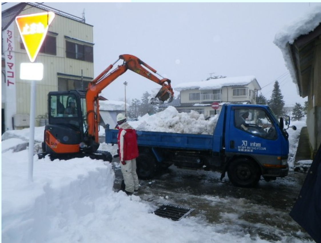
福島県会津坂下町 雪を捨てる場所がないため3日かけての排雪作業。