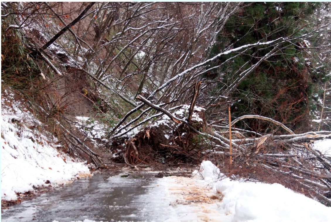
岩手県一戸町 2010.12.23大雨・大雪被害 「季節外れの大雨で崩落した土砂により通行不能となった町道」