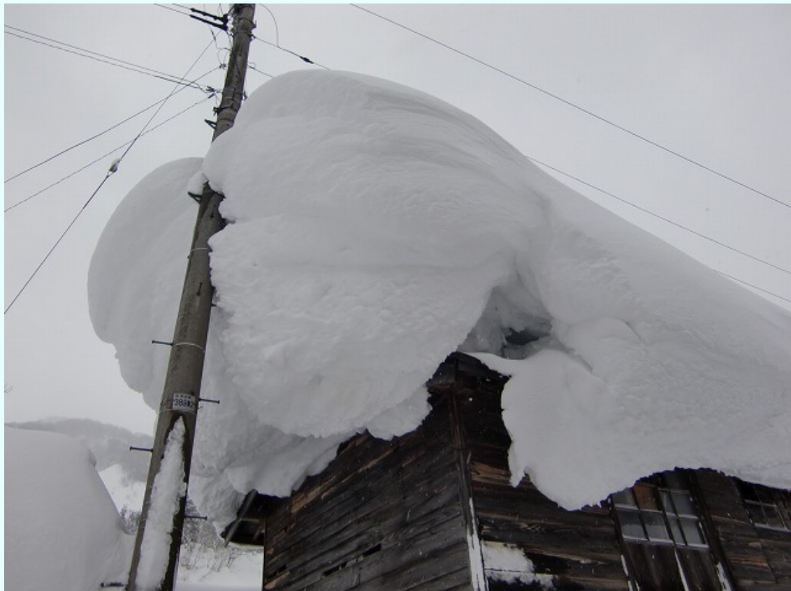
福島県只見町 降り続く雪による屋根への積雪状況（屋根の一部が破損）