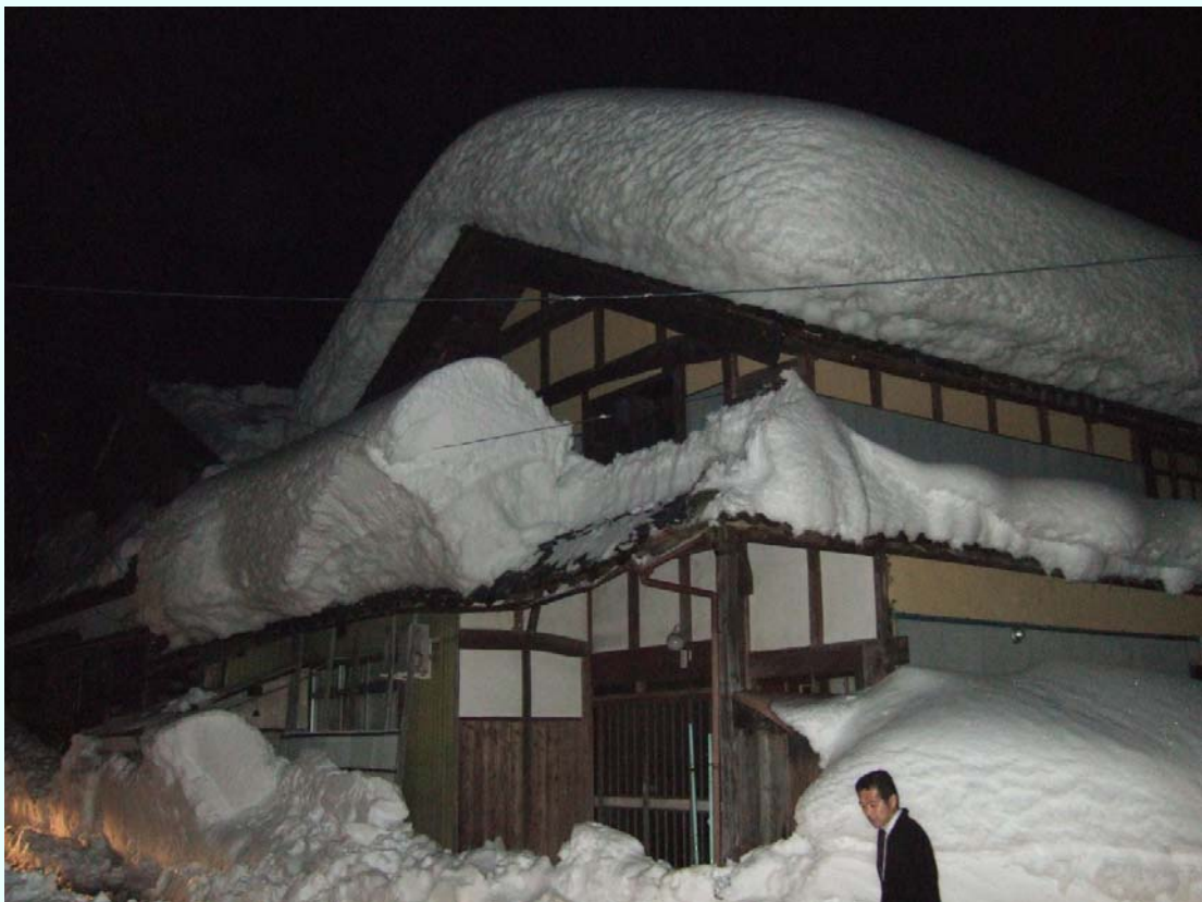
福井県南越前町 荒井 雪で押しつぶされそうな民家