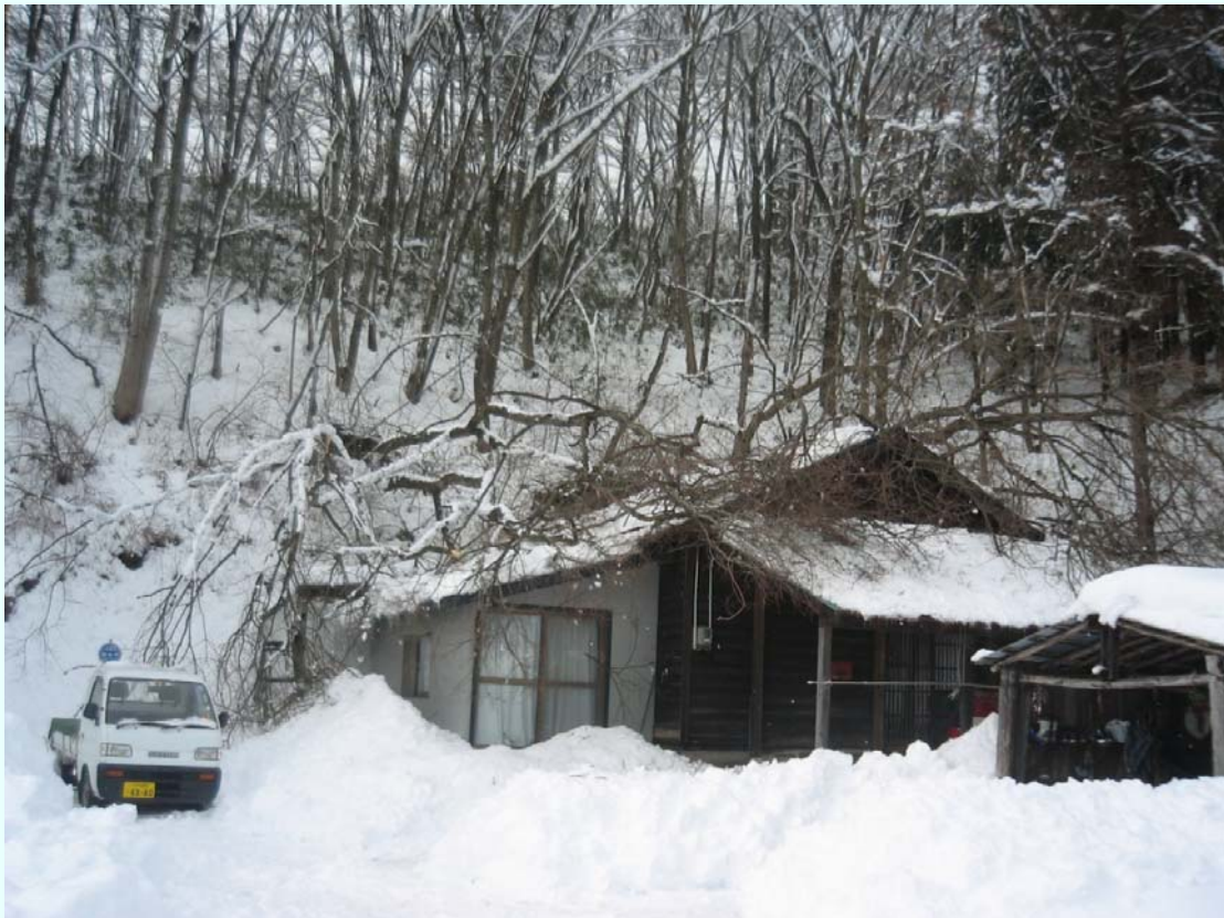
青森県三戸町 雪の重みにより民家の屋根に倒木。