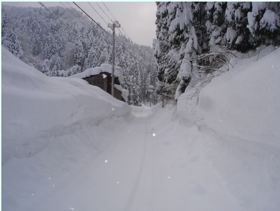
福井県池田町 除雪作業が追い付かない。(広瀬千代谷線 千代谷地係)