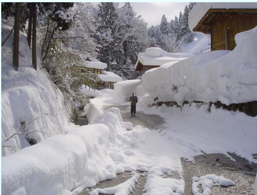
福井県池田町 人の倍以上積もった雪の除雪は高齢者には重労働すぎる。（金谷集落内状況）