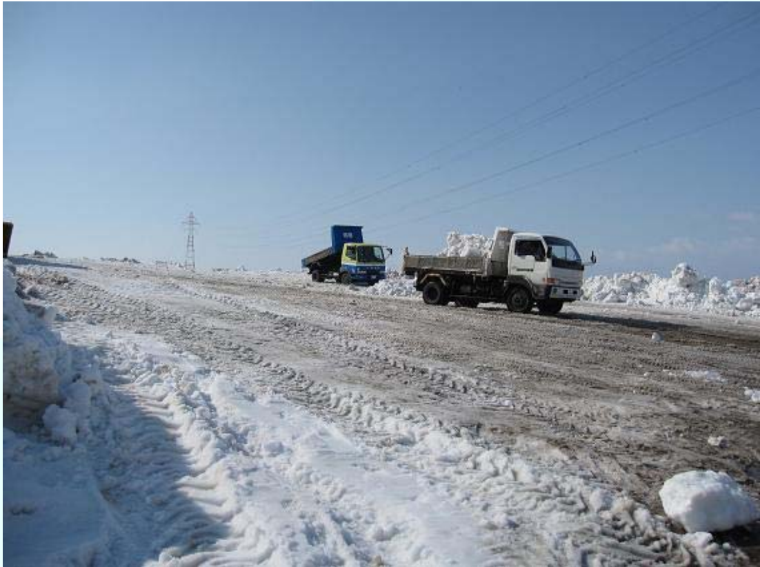
福井県永平寺町 除雪作業の雪が次々と運び込まれる。(永平寺町松岡河川公園)