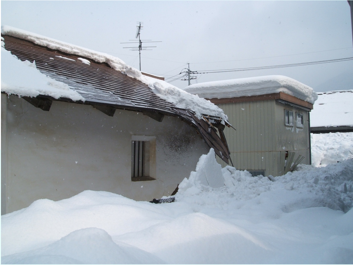
島根県飯南町 雪の重みで屋根が破損