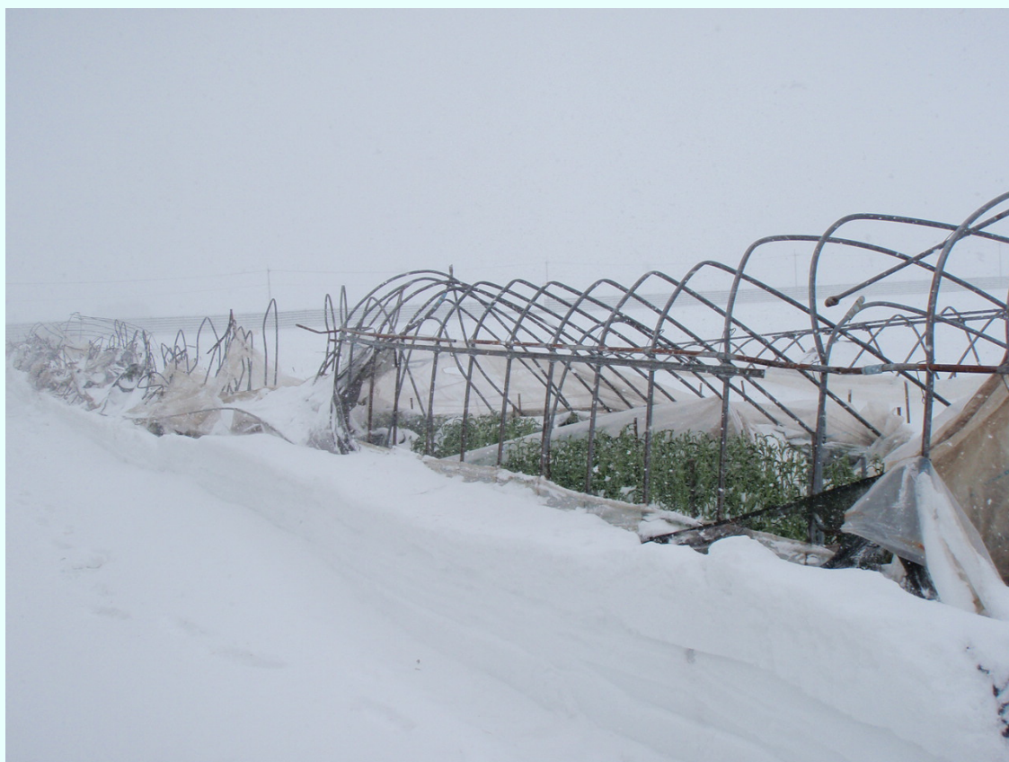
福島県会津坂下町 雪の重みに耐えきれずビニールハウスが倒壊。出荷予定だった花が全滅。