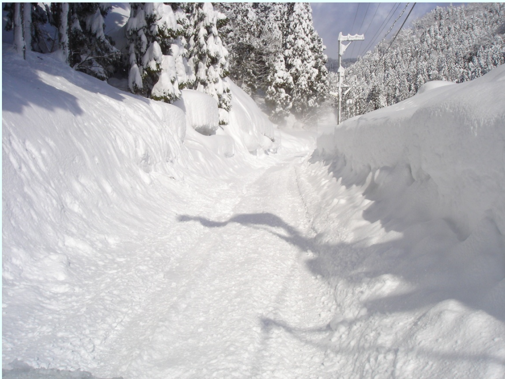
福井県池田町 町道広瀬谷口線 金見谷地係