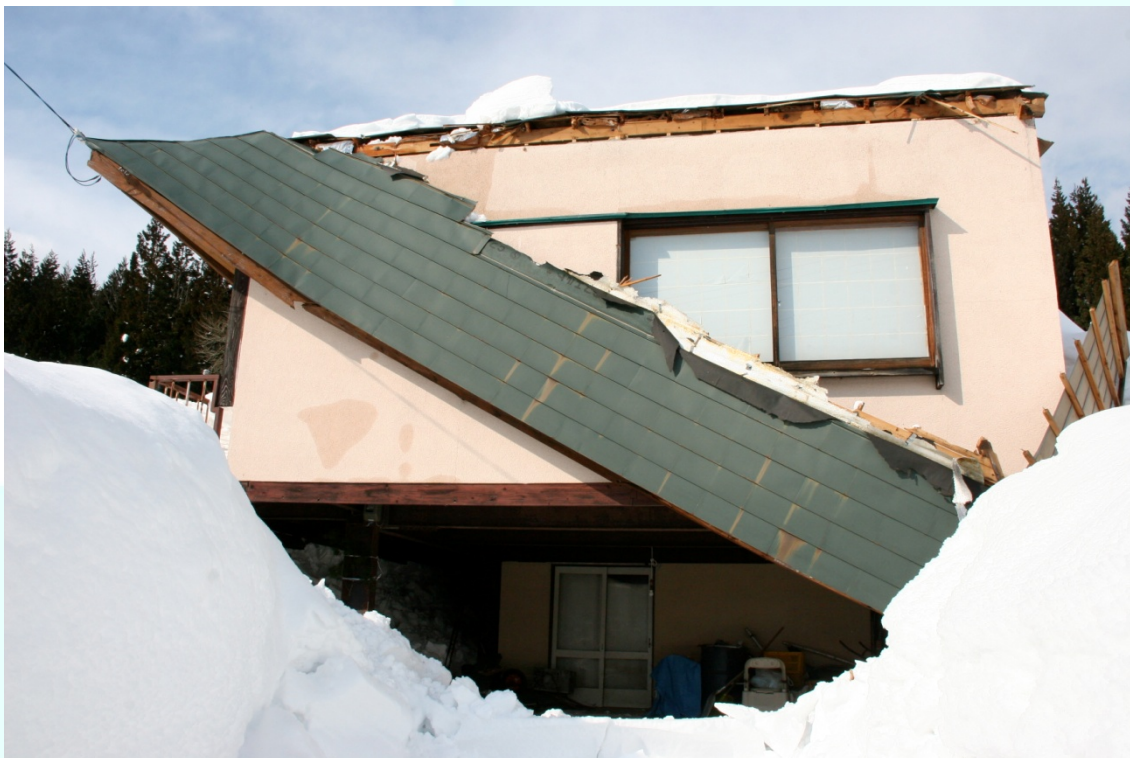
秋田県羽後町 過度の積雪により屋根部分が崩壊した一般家屋。