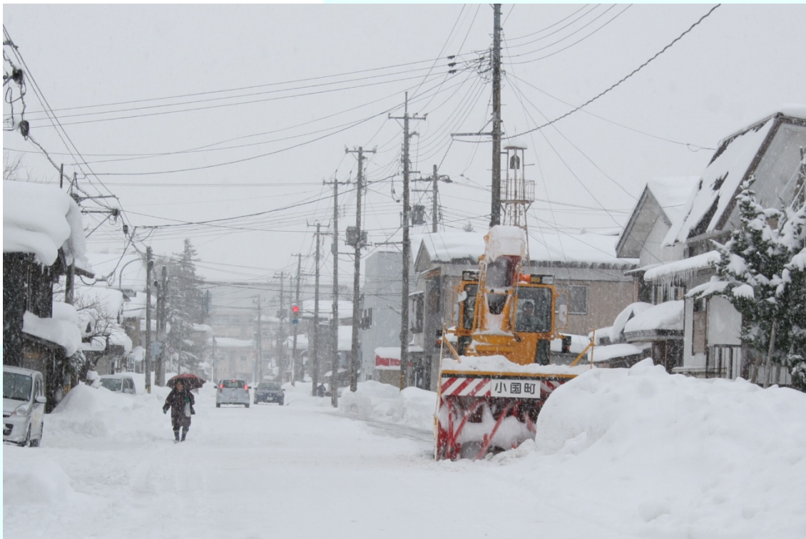
山形県小国町 大雪 町内の様子 12月25日から2月2日まで、連続した降雪が観測された小国町。気温が平年より低く推移し、雪が解けにくく、連日の道路除雪が行われた。