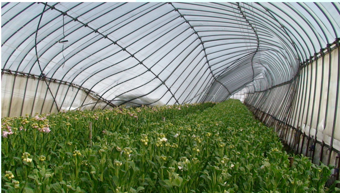
鳥取県大山町（旧大山町）年末年始の豪雪により倒壊したビニールハウス。