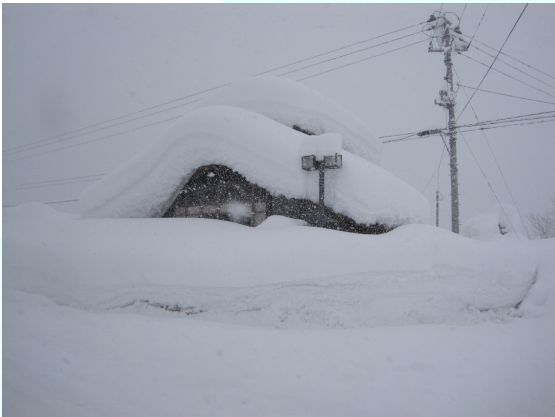
秋田県東成瀬村 積雪により管理不能となった村施設。