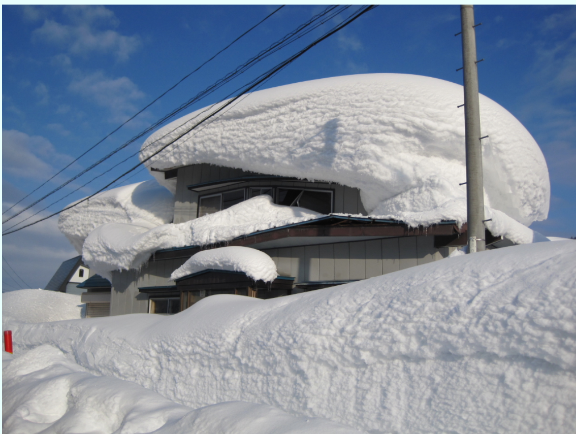
秋田県東成瀬村 除雪されず破損し、崩壊の危険性が生じている空き家。