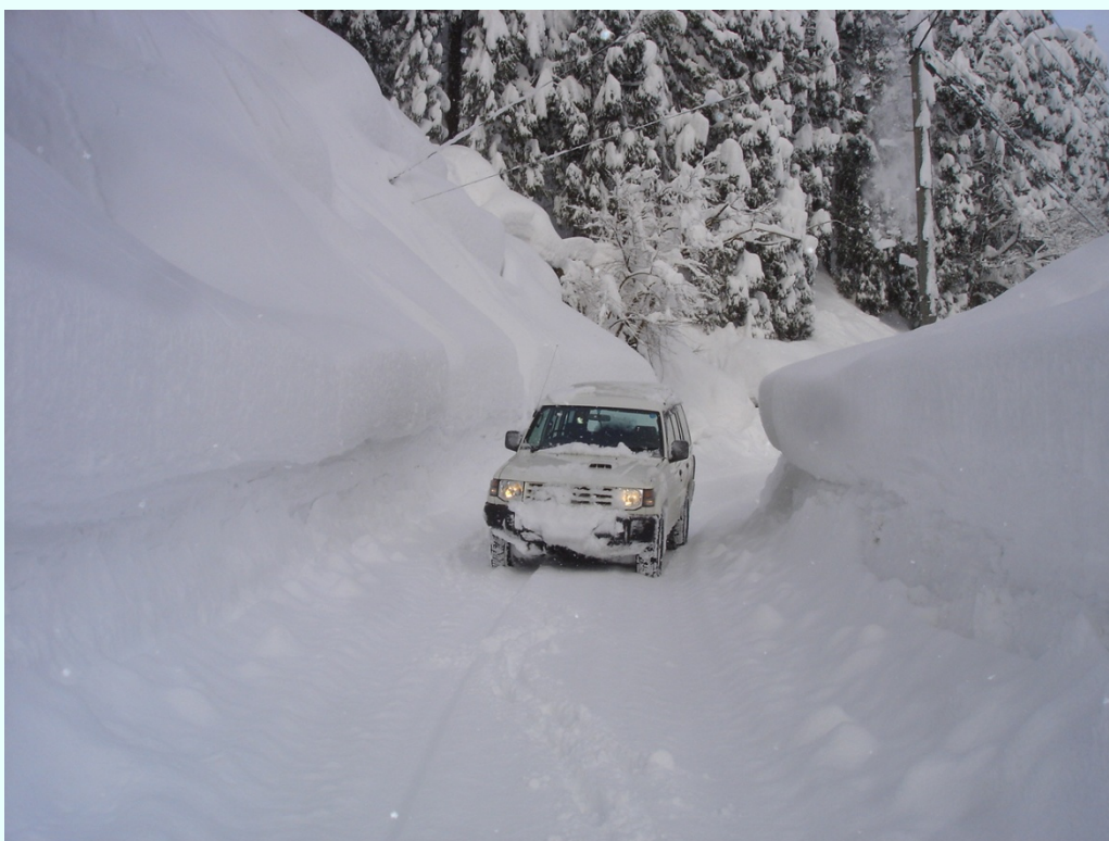
福井県池田町 パトロール中の車の前面も雪で覆われ路面が見にくい。(広瀬千代谷線 金見谷地係)