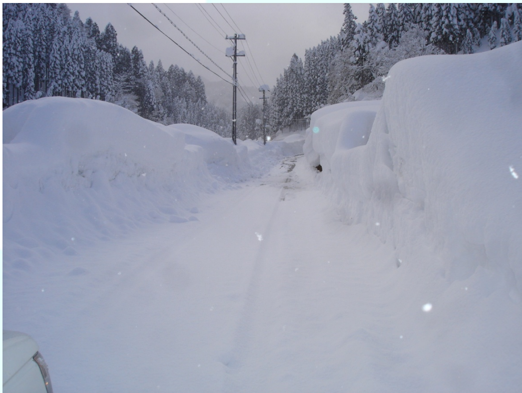
福井県池田町 除雪後横の雪壁は3メートル程度。（広瀬千代谷線道路状況）