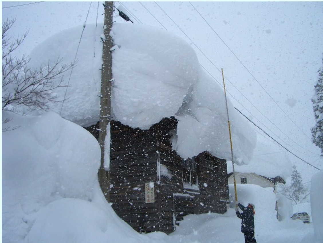
福島県只見町 降り続く雪による屋根への積雪状況