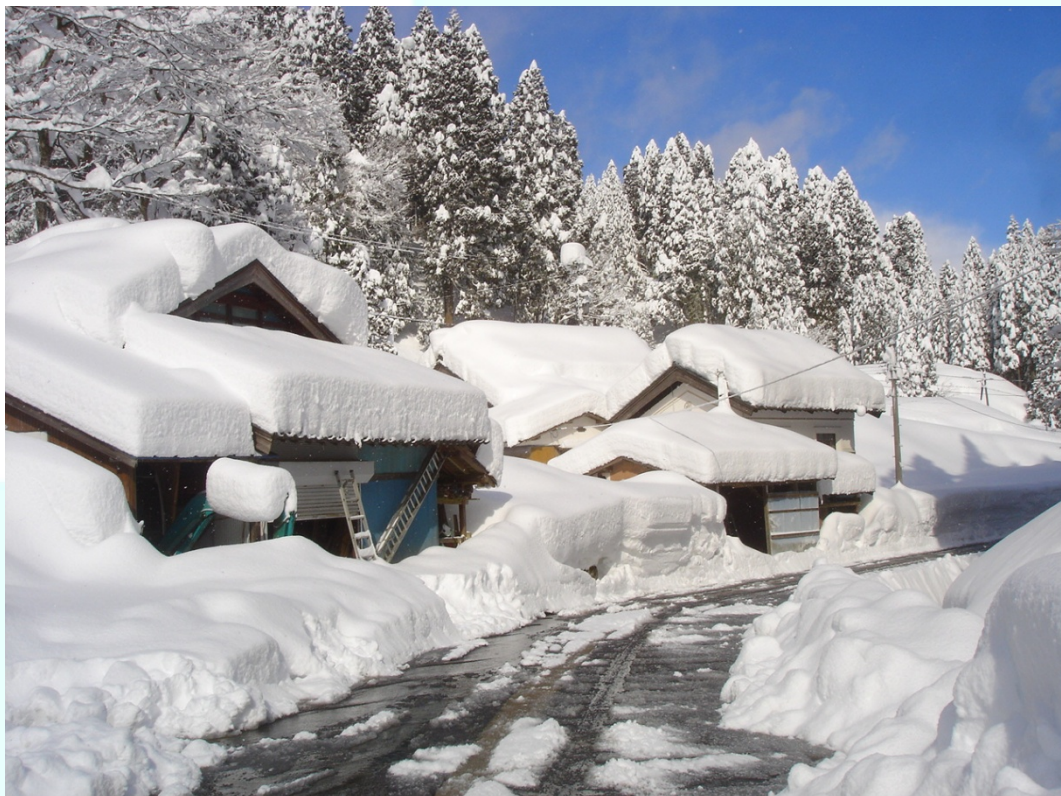
福井県池田町魚見集落内 軒下まで積もった雪で屋根まで届きそうな勢い。