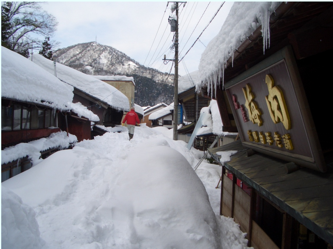
福井県南越前町 今庄地区中心部 融雪装置も追いつかないほどの積雪 2階部分まで雪に覆われ車の通行ができない駅前商店街