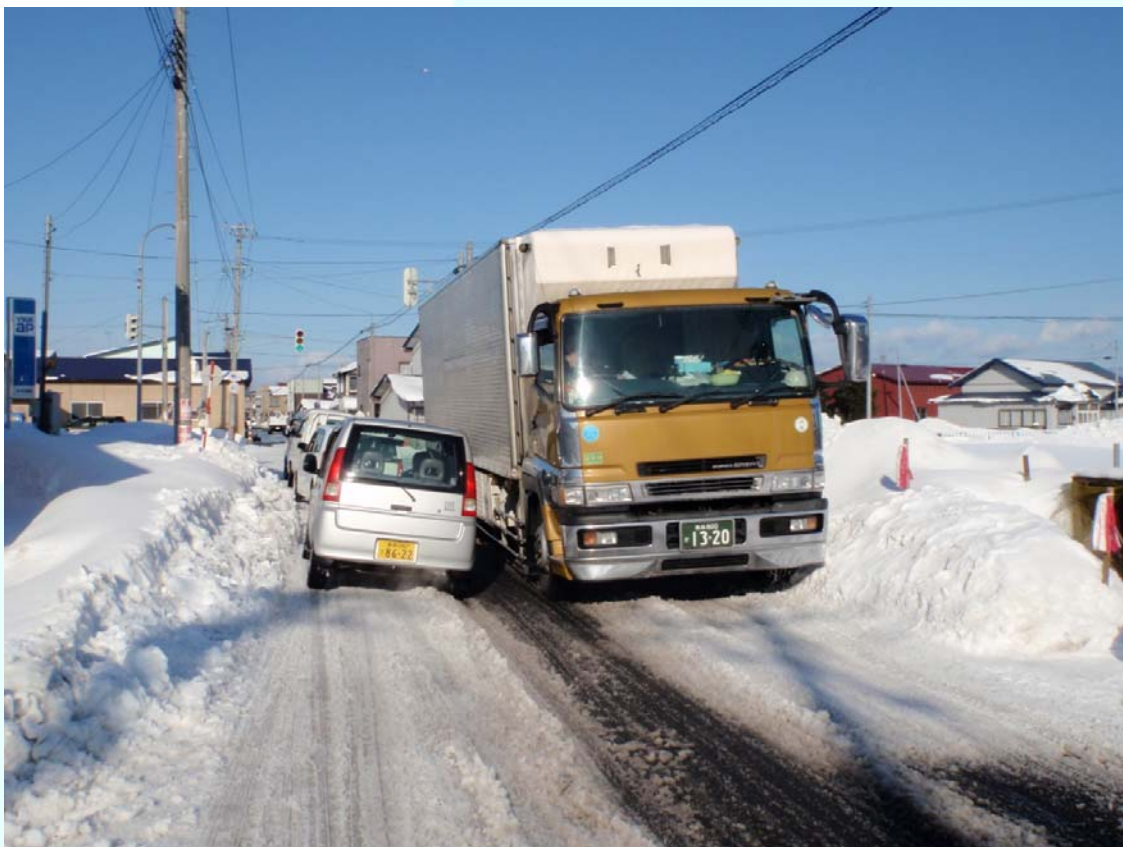
青森県鶴田町 雪により道幅が狭くなり、すれ違いに支障を来している。