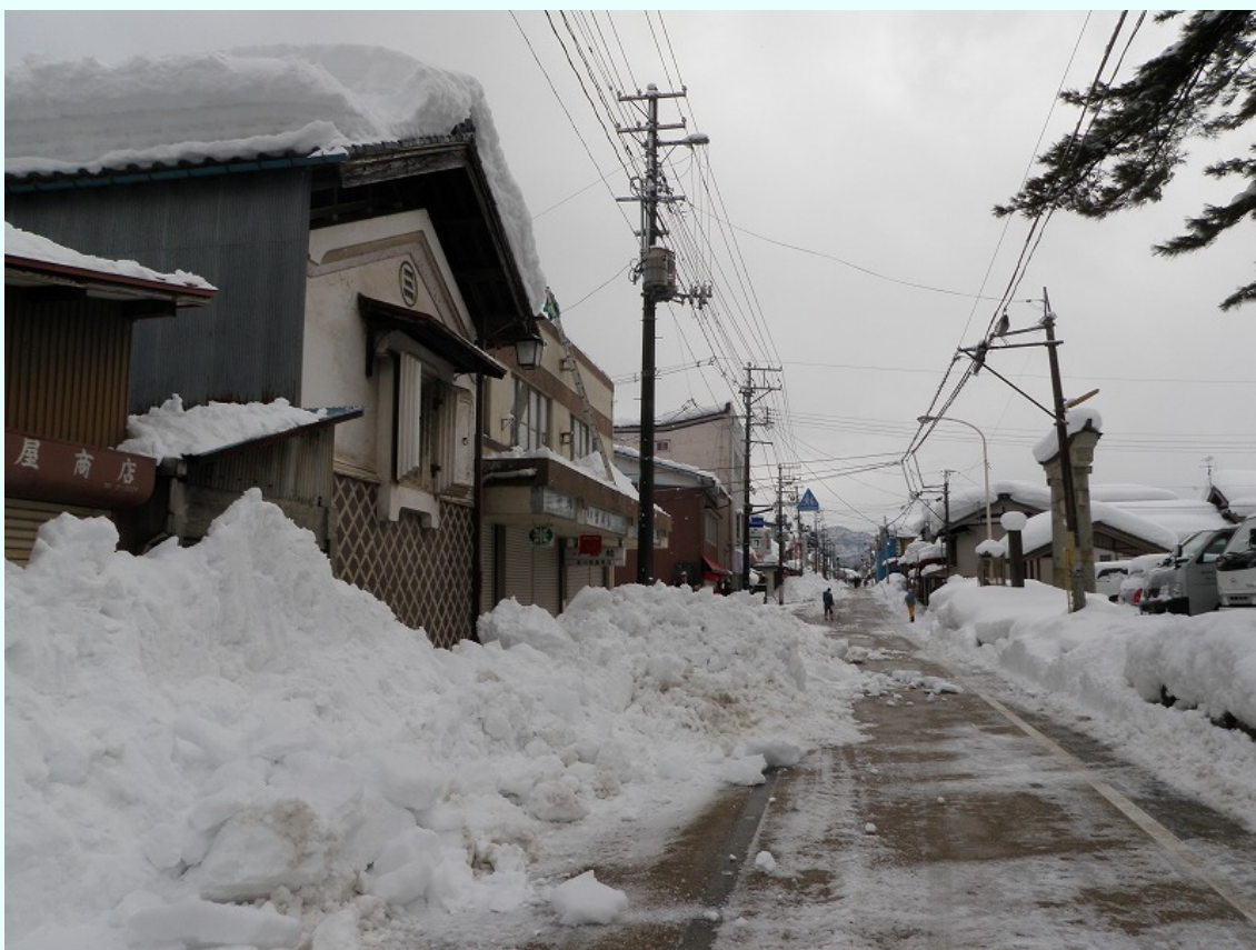
新潟県阿賀町（旧津川町）：中心部の状況