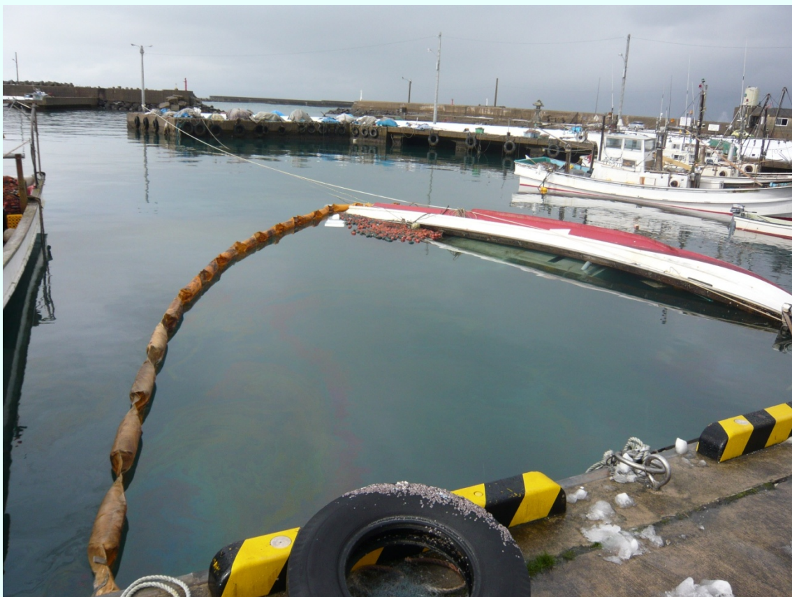
鳥取県湯梨浜町（旧泊村）雪の重みによりバランスを崩し転覆した漁船。