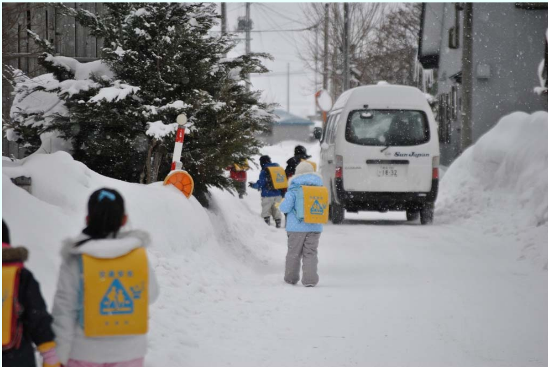
青森県板柳町 雪で狭くなった通学路は、危険と隣り合わせ。