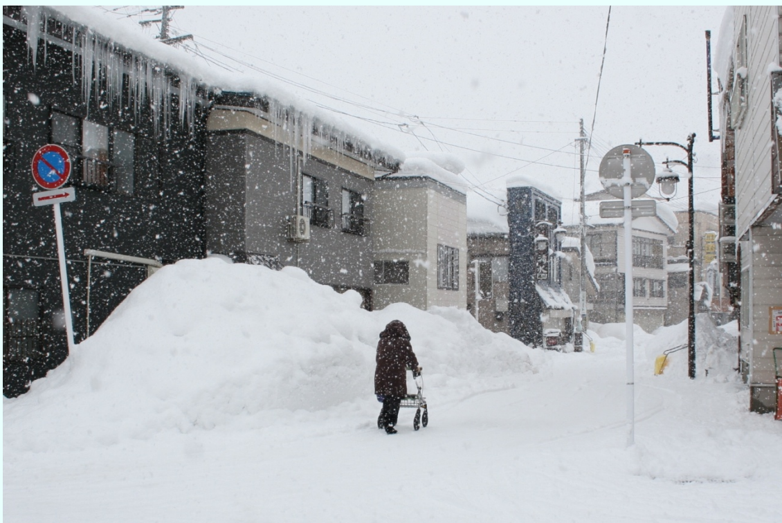
山形県小国町 大雪 町内の様子 雪の影響により、道路標識が傾いている箇所も見受けられる。積雪により道幅が狭くなり、安全安心な住民生活への影響が危惧される。