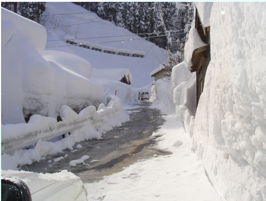
福井県池田町 壁のような降雪のため、雪の捨て場がなく除雪作業がむずかしい。(魚見集落)