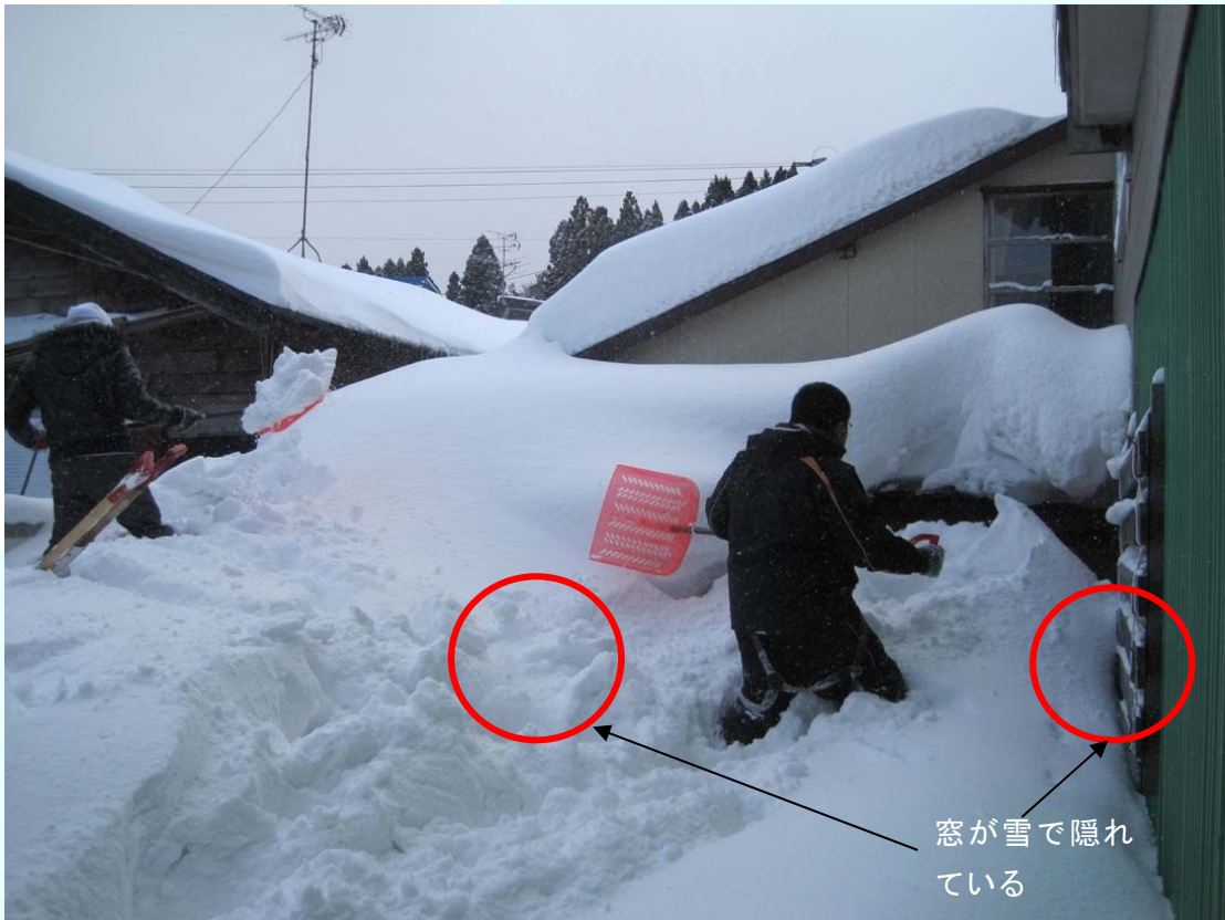
青森県今別町 一人暮らしの老人宅の除雪。雪が軒先まで積もり、窓が完全に隠れている。