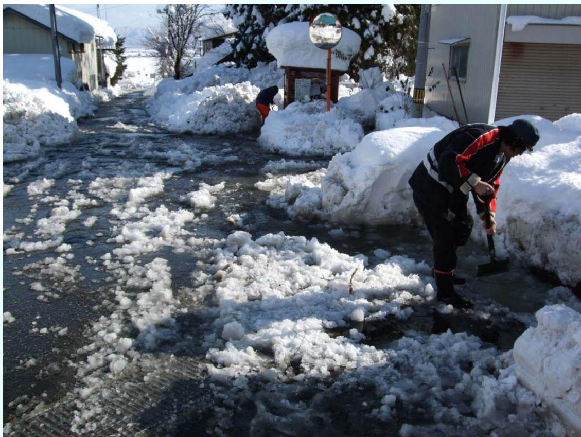
福島県会津美里町 高田地域 水路への排雪により水害発生 消防団員による水害対応