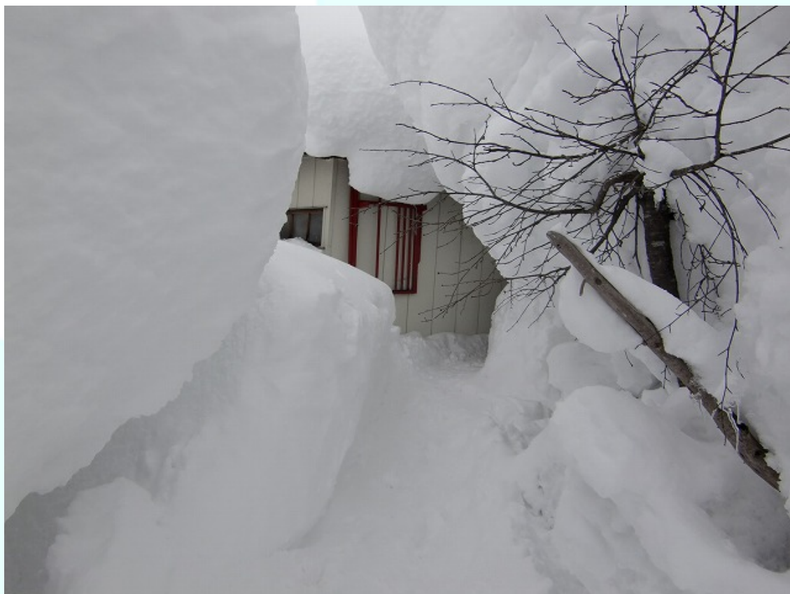
福島県只見町 積雪により玄関入口が覆われている。