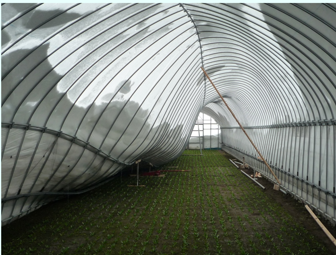
秋田県美郷町 過度の積雪により押しつぶされた栽培中のほうれん草用ハウス。