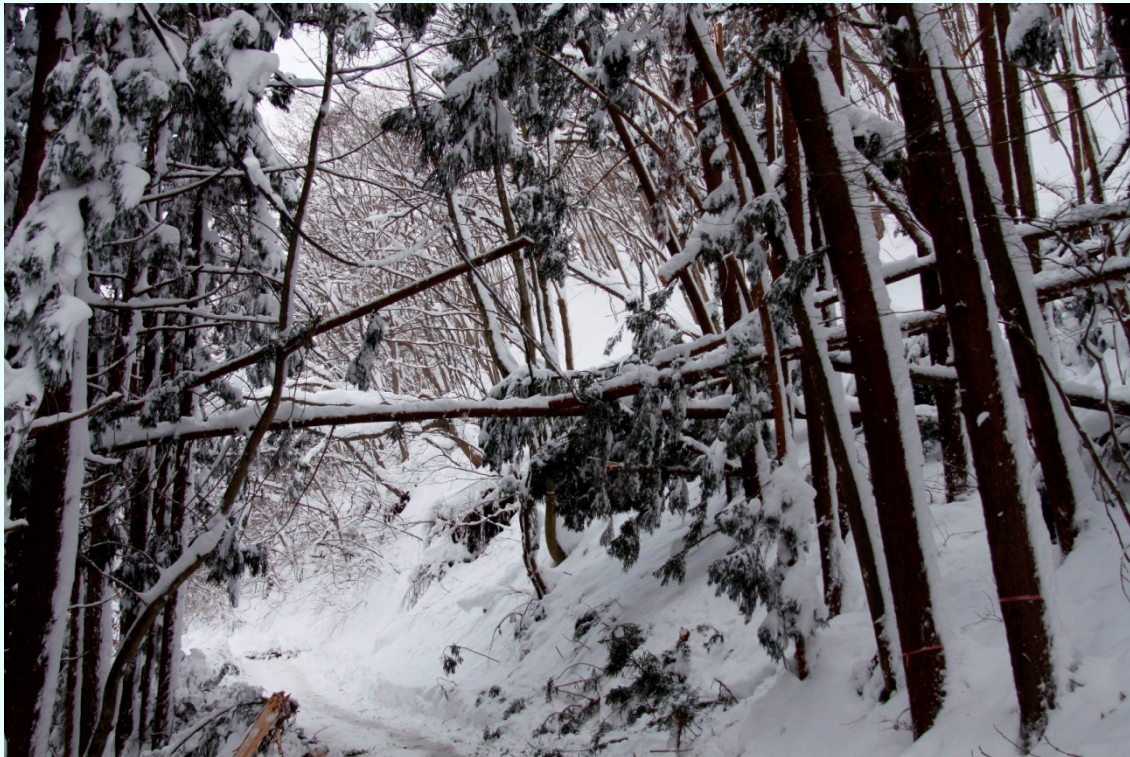
岩手県一戸町 2010.12.31大雪1 町道へ雪の重みで倒れた樹木