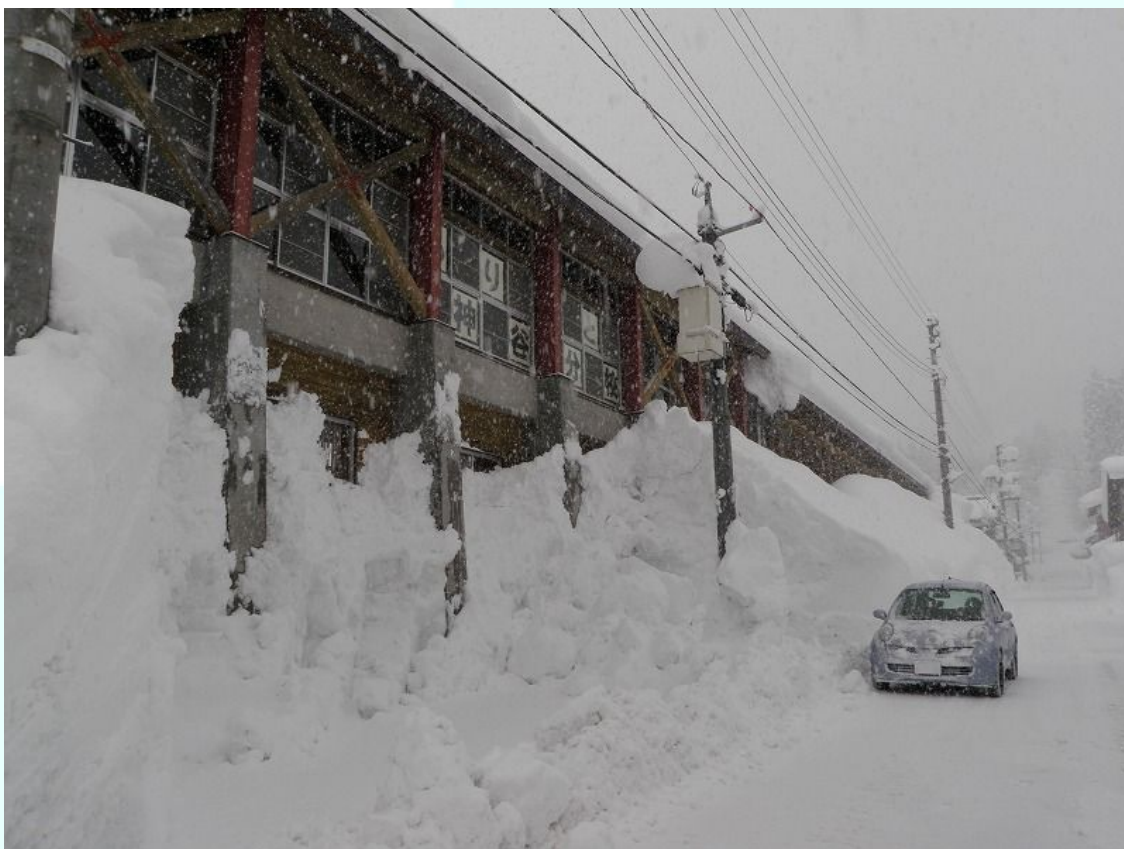
新潟県阿賀町（旧上川村）：学校施設も雪に埋まっている。