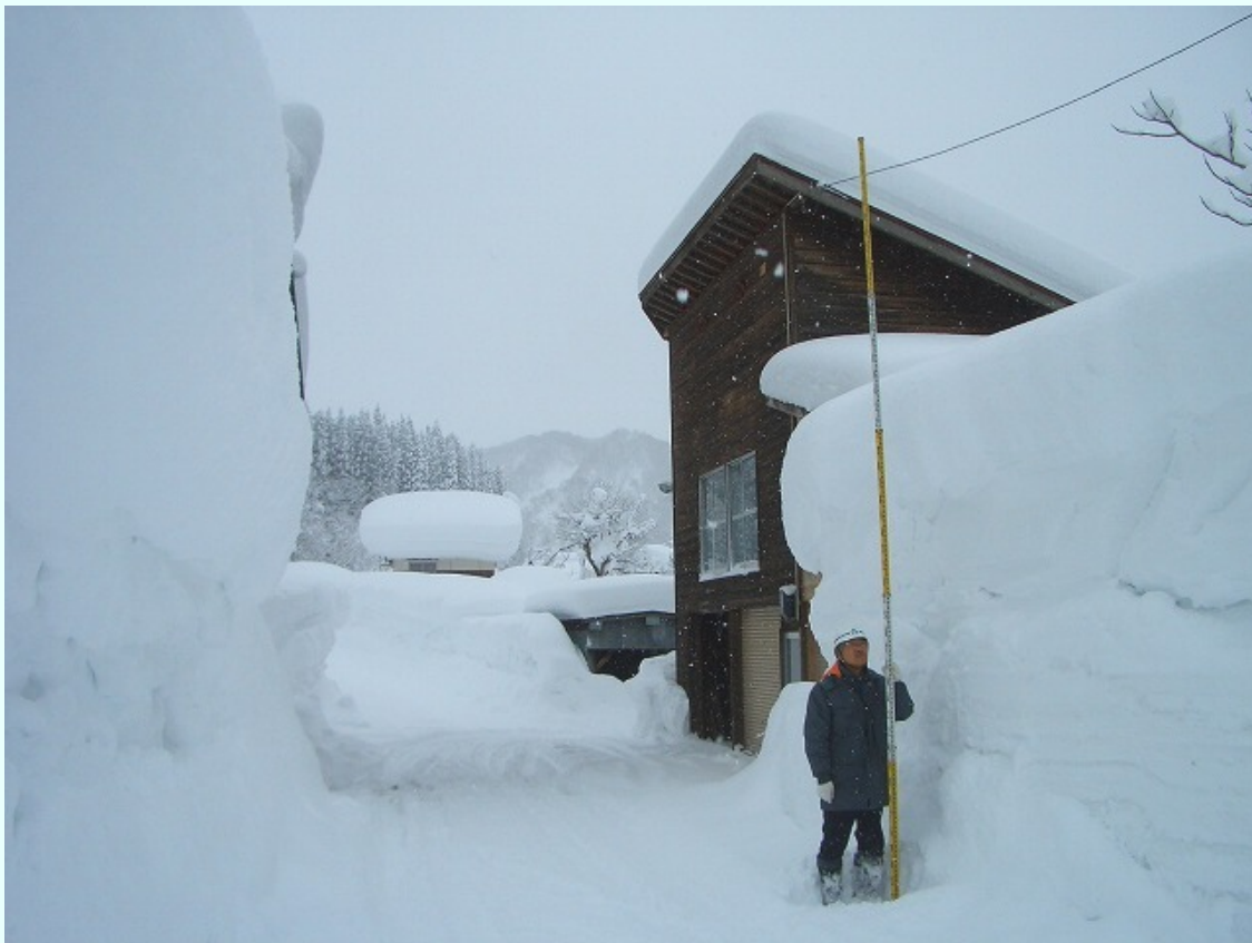
福島県只見町 積雪深は、3メートルを超える状況。