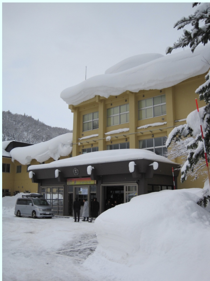
秋田県東成瀬村 落雪の危険のある中学校。