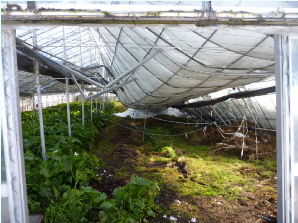
福島県猪苗代町 積雪によりパイプハウスの屋根がつぶれている。