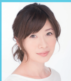
フリーアナウンサー 富永 美樹氏