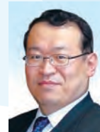
牧野 光朗 長野県飯田市長