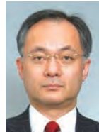
辻 琢也 一橋大学大学院 法学研究科 教授