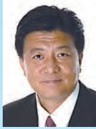
新藤 義孝 内閣府特命担当大臣 (地方分権改革)