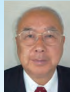
川添 健 鹿児島県長島町長