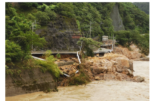
2020年7月豪雨・熊本県・球磨村