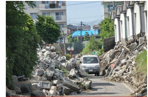
2016年熊本地震・益城町