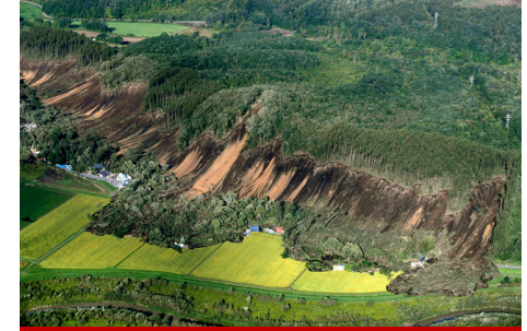
2018年北海道胆振東部地震・厚真町