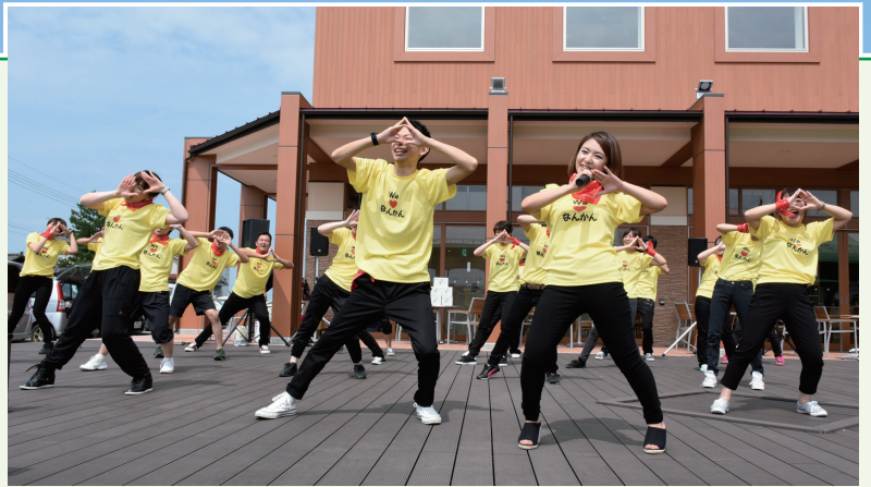
ダンスチーム「なんかんそだちーズ」

シンポジウム第2部の「読み解きトーク」では、若手職員の方にもご参加いただき、研究者が中堅職員・若手職員の両方からのご意見を伺いながら、どのようにして職員が自主性を発揮しているのか、それを可能とした職場風土はいかにして育まれたのかなどを深掘りします。