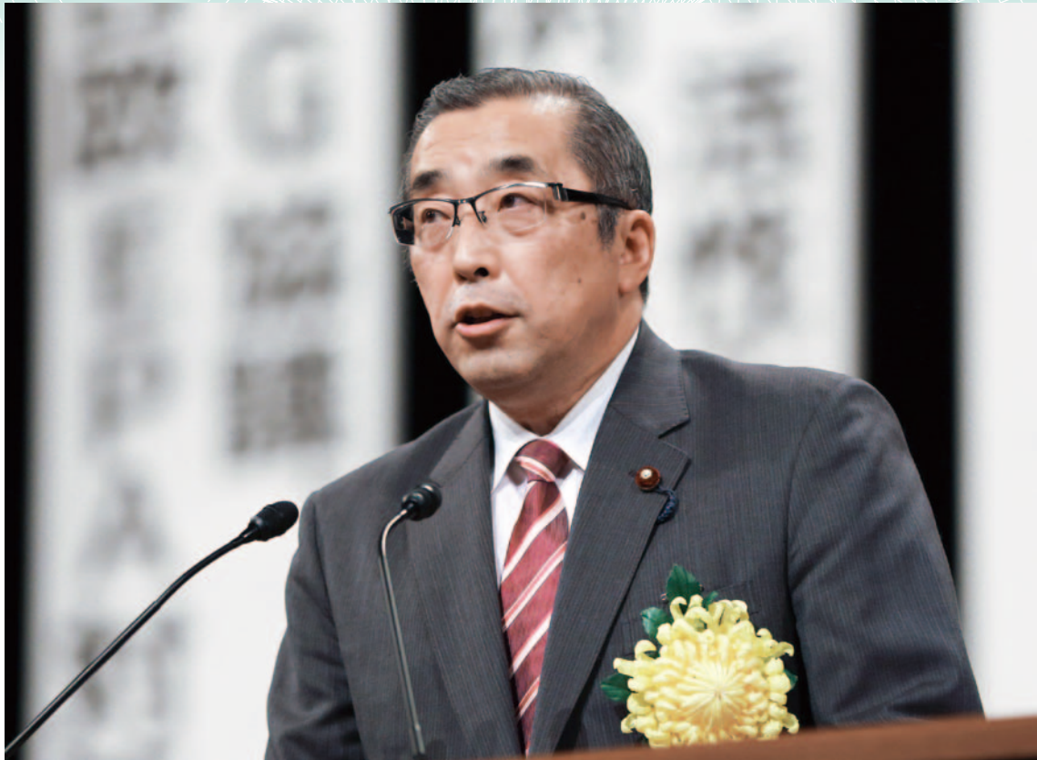
総務大臣代理 鈴木 淳 司 総務 副 大 臣