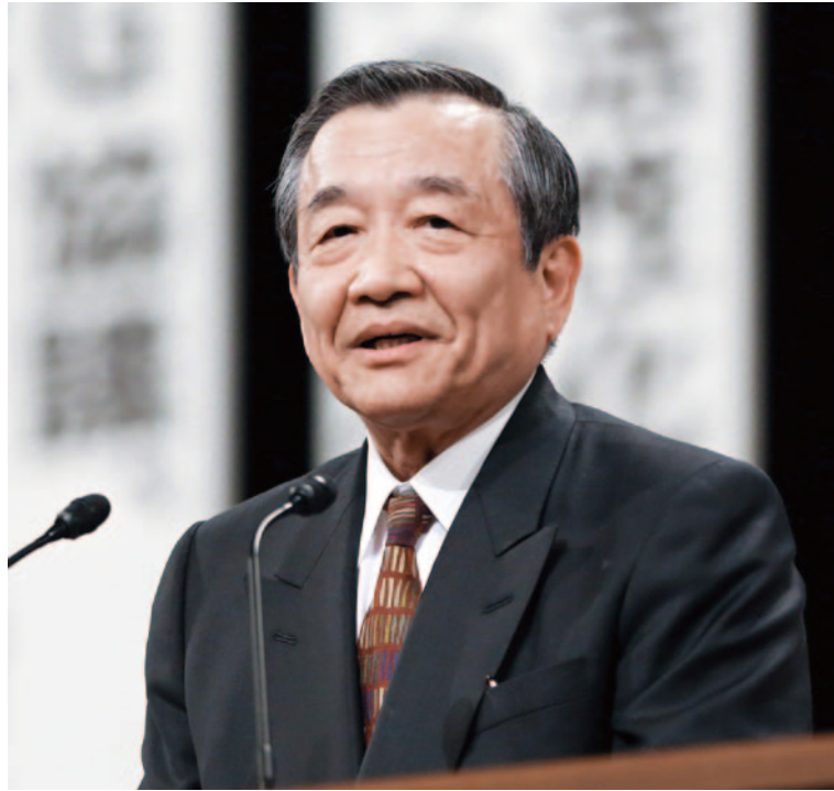
財政委員会委員長 京都府井手町長