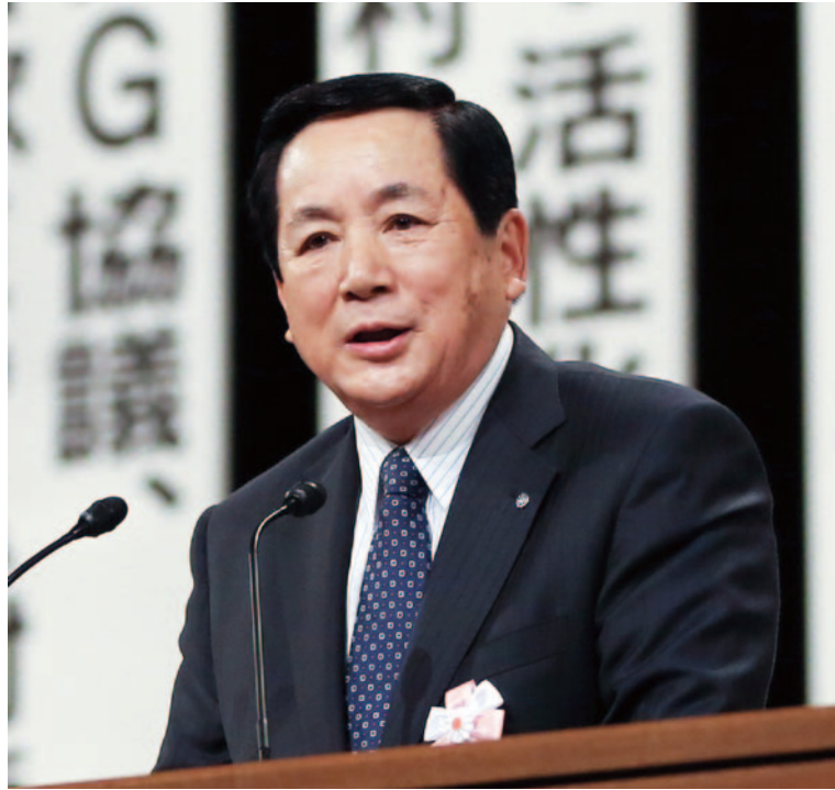
経済農林委員会委員長 宮崎県西米良村長