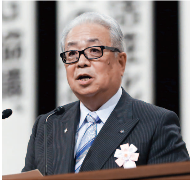
行政委員会委員長 埼玉県嵐山町長