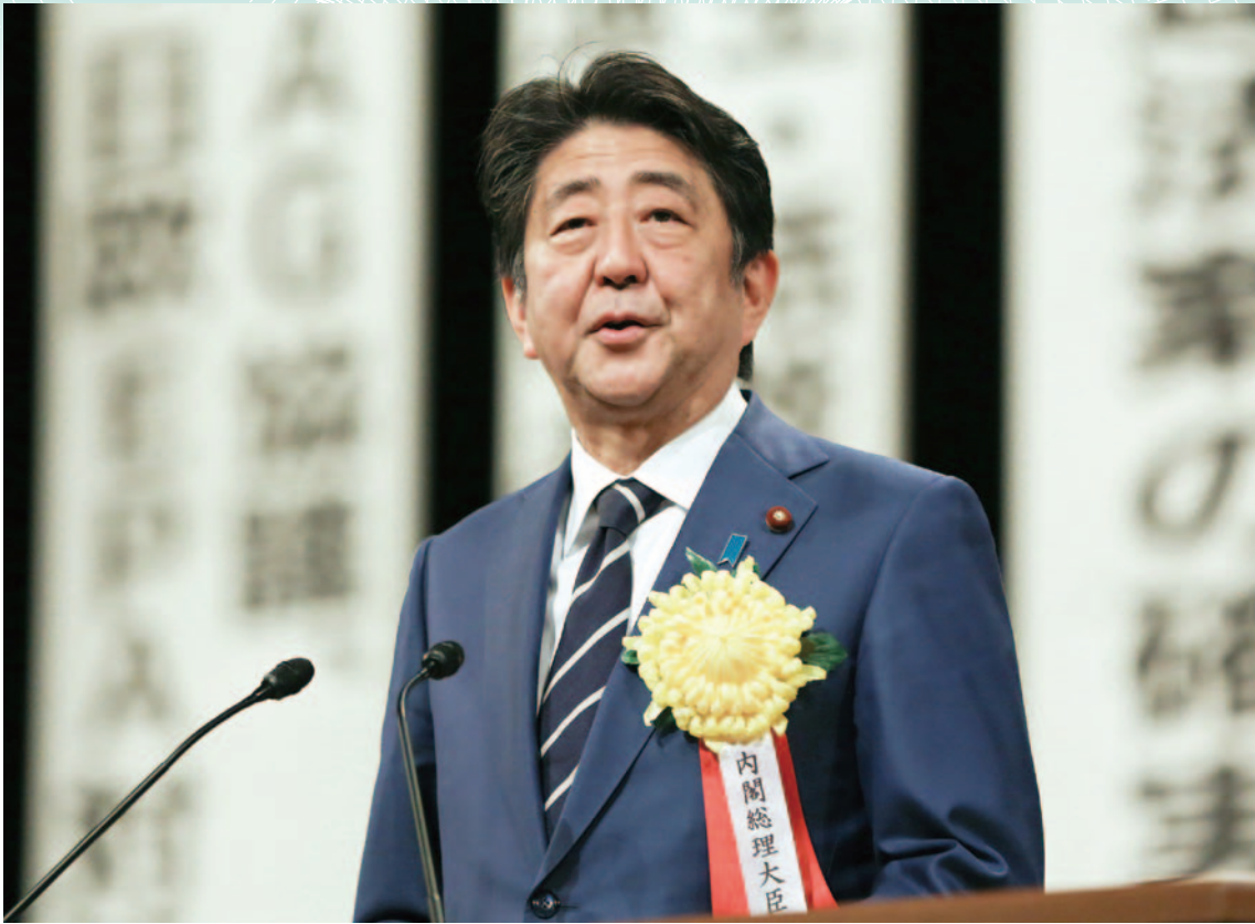
内閣総理大臣 あ べ 安倍 しんぞう 晋三

全国町村長大会が、本日、盛大に開催されますことを、心からお慶び申し上げます。私の地元山口県の皆様、この目の前の特等席に座っておられます。事務局の皆様の御配慮に御礼を申し上げますと、こう思います。大変プレッシャーを感じているところですが。町村長の皆様には、日頃から地方自治の最前線で、地域社会の発展や住民福祉の向上に尽力されていることに、心から敬意を表します。