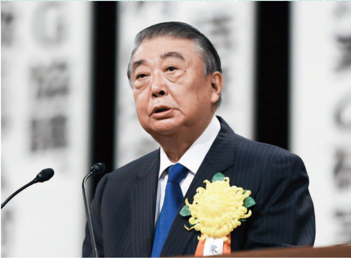
衆議院議長 おおしま 大島 ただもり 理森