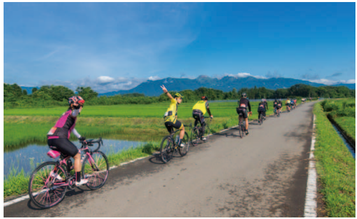
◁那須の風景とサイクリスト