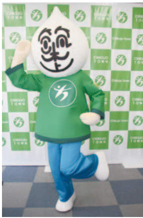
年齢・誕生日不詳。ダンスが得意で、築上町の海や山、自然をこよなく愛する男の子。趣味は史跡めぐり。航空自衛隊築城基地航空祭での記念撮影では行列ができるほどの大人気

2014年に一般公募により、県内外からの応募674件の中から誕生したマスケットキャラクター。顔は、海と山の雲をモチーフにした輪郭に、「築上」の文字で目鼻口を表現しています。洋服は、山をイメージしたグリーンと海をイメージしたブルーの上下に、胸には町章、左腕には大好物のスイートコーンが描かれています。背中には築上町の郵便番号「8029」が記され、全身で町を表現。町内外のお祭りや観光PRイベントに参加しては、得意のダンスを披露することもある。2017年にリニューアルした「築上町コミュニティバス」の車体にも描かれ、利用者に親しまれています。ふるさと納税記念品限定のオリジナルワッペンも人気。町のホームページで観光名所を紹介したり、イベントの報告をしたりと、町の魅力を元気に発信しています。