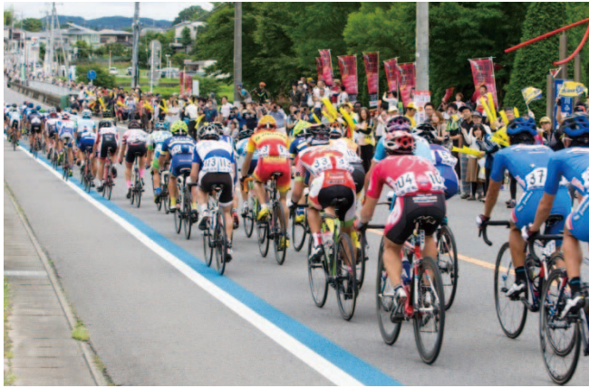
▷全日本自転車競技選手権大会

自転車は、環境にやさしく健康的な乗り物として親しまれています。また、風をきって颯爽と走ることですトレス解消にもなります。自転車が身体を補助してくれるので、長時間、長い距離を走ることが可能となり、特に、自然の中でのサイクリングは心身に良い影響を与えます。更には自転車に乗り続けることで「脂肪燃焼・タイエット効果」「心肺機能の向上」「脳の活性化」「持久力の向上」「下半身の筋力アップ」「睡眠の質の向上」などの効果が期待でき