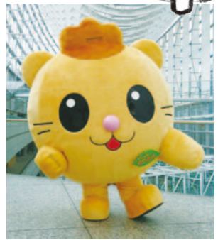
2013年5月25日生まれ。森の妖精。恐羅漢山にある「森林セラピーロード」の大木の根元にいることが多く、森でのお昼寝が大好き。包容力が優れている。鮎や祇園坊柿が好物