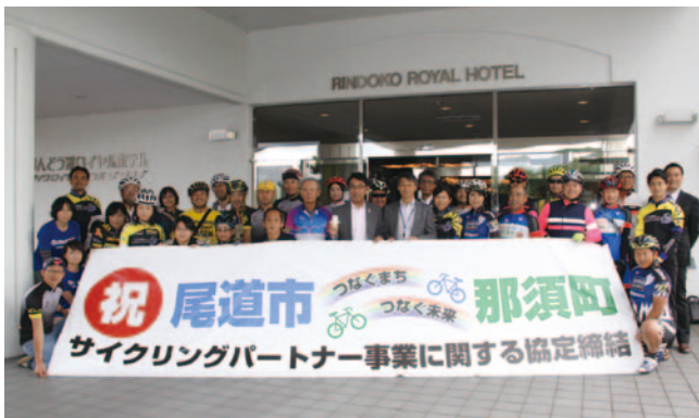
△尾道市とのサイクリング協定

那須町のサイクリングスポーツ事業は、平成23年7月に第1回那須高原ロングライドが開催されたことが始まりです。このロングライドは、東日本大震災の風評被害により離れた観光客を呼び戻そうと、数人のサイクリストが発起人となり始まりました。自粛ムードがある中「那須から元氣」を発信しようという開催にこぎつけ、第1回大会は800名の参加者でしたが、第7回目を迎えた今年度は、700名となり、一番人気のコースは募集から1時間もか