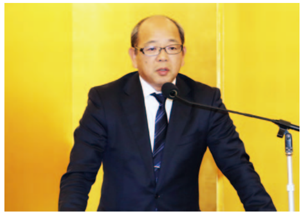
◀町村長代表・木場鹿児島県錦江町長