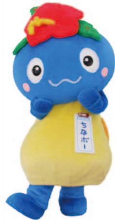
2015年8月1日生まれ。背中に甲斐のある知名町の不思議な妖精の男の子。元気で優しく、みんなと交流したり、写真撮影したりするのが大好き。ダンスが得意だが、早い動きは苦手

鹿児島市から54.6kmにある沖永良部島の南西部に位置する知名町で誕生した不思議な妖精で、町のマスケットキャラクター。町の豊かな自然から産まれた「ちなポー」は、頭の上に町の花ハイビスカスを載せています。「みへでいろ（＝ありがとう）」という島の方言が大好きで、いつも感謝の気持ちを忘れずに、町民に元氣と笑顔を届けています。「ちなポーのつばやき」と題した町の公式フェイスブックでは、語尾に「〜だポー」とつけて、イベントの告知などを発信。サービス精神が旺盛で、お声がかかればできるだけお応えし、どこへでも駆け付けるフットワークの軽さが自慢なのだとか。島内外、県内外のイベントや物産展に積極的に参加して、町のPR活動に励んでいます。