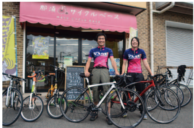
◁那須サイクルベース

ビチャリ（骨伝導イヤフォン）による音声ナビにより観光施設の案内やサイクルピットの案内などを行うスマートフォンアプリ）を開発し、現在、精度を高めるための実証実験を行っているほか、既存のナビゲーションアプリ等と連携するなど、ITを活用したサイクリストにとって便利で安全なサービスの提供も目指しています。