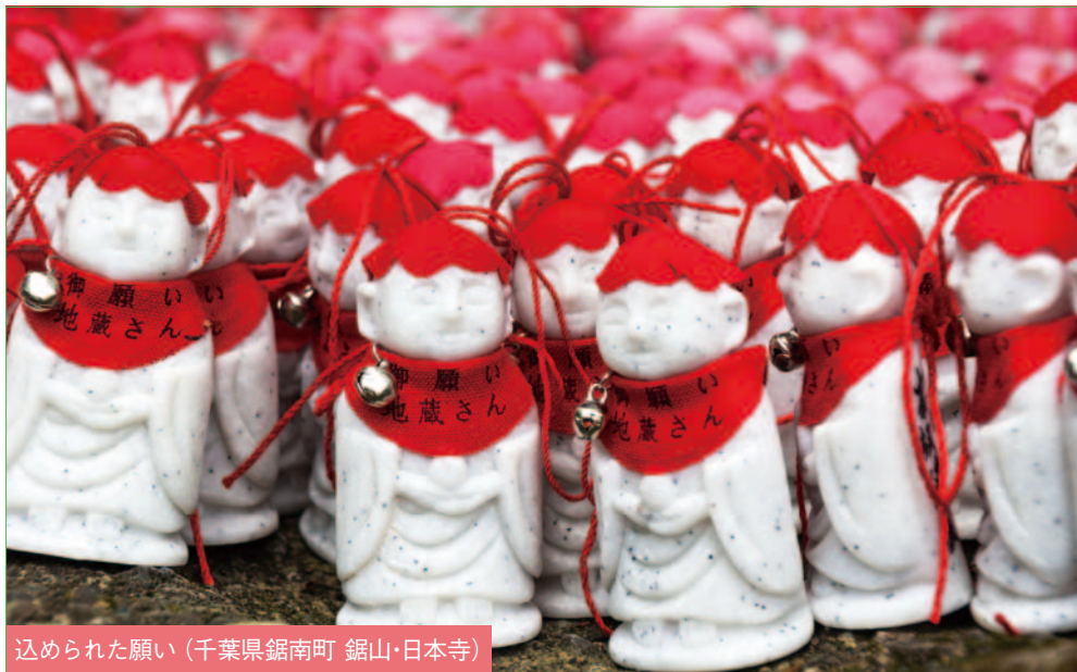
込められた願い (千葉県鋸南町 鋸山・日本寺)