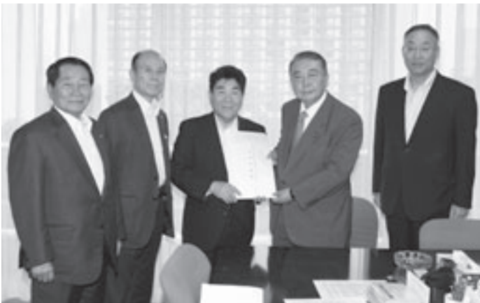
▲大島理森 東日本大震災復興加速化本部長（右から2人目）