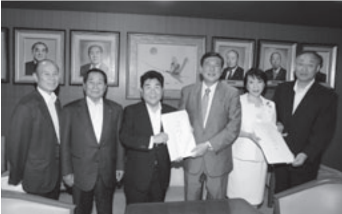
▲石破茂 幹事長（右から3人目）、高市早苗 政務調査会長（右から2人目）