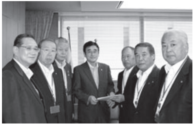
▲岡崎浩巳 総務事務次官（中央）