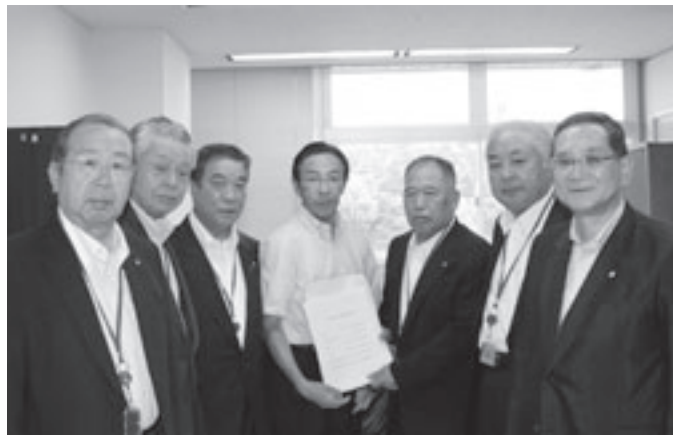
▲西脇隆俊 総合政策局長（中央）