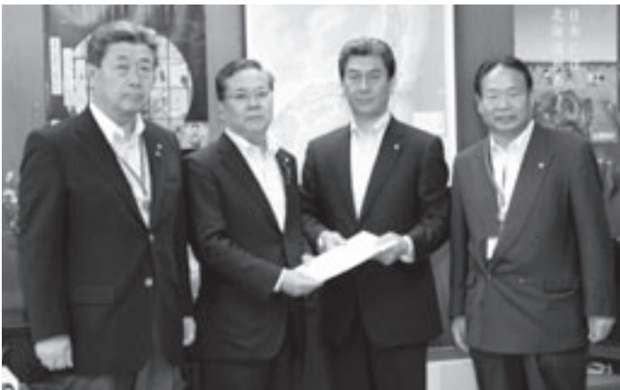
▲横山信一 農林水産大臣政務官（左から2人目）