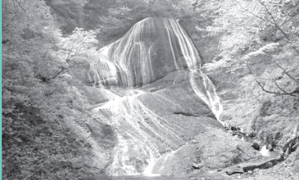
みろくの滝 (青森県田子町)