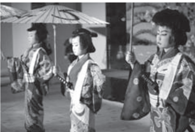
▷田峯小学校の児童達による「白波五人男」

小学生の頃から地元の伝統芸能「歌舞伎」に関わっていくことで、伝統芸能を守っていくという意識が醸成されており、成人になって仕事の関係で他町村に住んでいても祭りには帰ってきて歌舞伎を演じる若者もいます。また、田峯地区に住んでいる若者たちは、自分の子ども達に自分が過ごしてきた時間と同じように、指導者と立場を変えて歌舞伎の伝承をおこなっています。