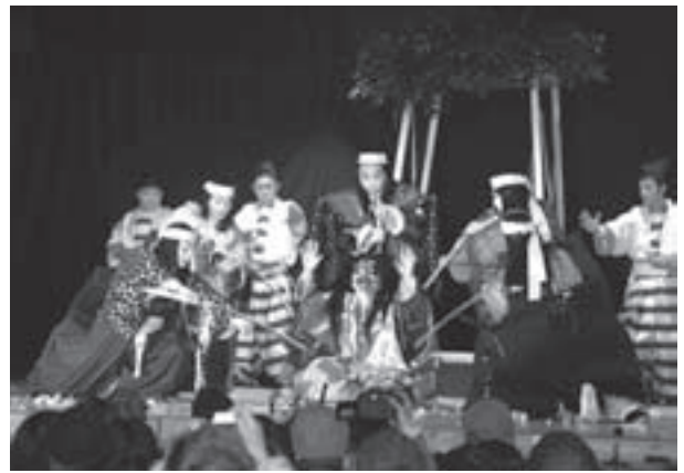
◁素人歌舞伎では珍しい「土蜘蛛」