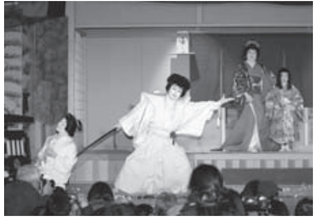
▽菅原伝授手習鑑 寺子屋の場