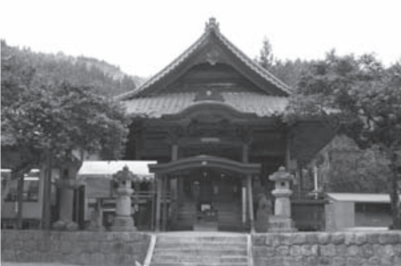
▷「田峰観音」谷高山高勝寺

以降、300年以上にわたり、太平洋戦争中も途切れることなく、奉納歌舞伎は続けられています。