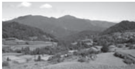
△大石・吉延地区の棚田風景

その後も、専門家の講演会や先進地視察、試験栽培などを重ね、ついに平成21年「土佐天空の郷」は誕生しました。栽培面では、生産者全員にエコファーマー認定を義務付け、環境保全型農業に取り組んでいきます。毎年土壌診断を実施し、お米づくりに適した土づくりを行い、特別栽培米の基準(科学合成農薬・化学