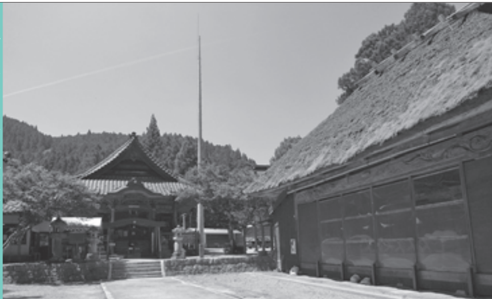
田峯観音と歌舞伎舞台(愛知県設楽町)