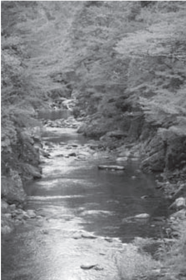
四季折々に美しい姿を魅せる汗見川。

今後は、町内の豊富な地域資源を活かした取り組みを更に推進しながら、美しい地域づくりを進めてまいります。