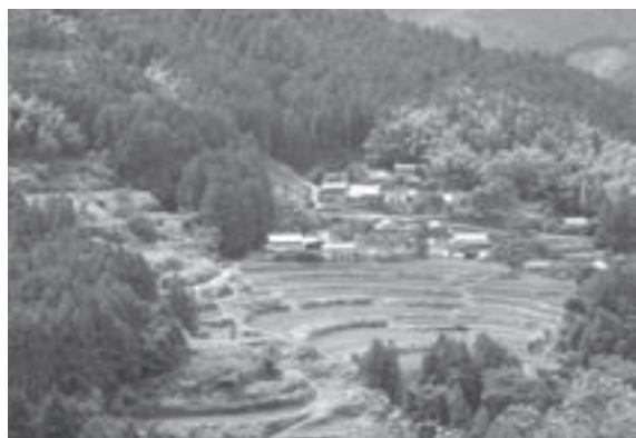
△大石地区の棚田風景

肥料当地比5割減)で生産を行っています。さらに高知県の特色を活かした室戸海洋深層水濃縮ミネラル水稻栽培の取り組みを進め、お米の甘みを向上させてまいりました。 品質においても、食味分析機による採点、通常より大粒のお米を揃える米選機、着色粒や被害粒を取り除く色彩選別機を行程に取り入れるなど、厳しい基準で高品質なものへ仕上げられています。 また、現在、日本で最も美しい村連合加盟や土佐天空の郷によって全国から注目を集める中、お米などの農産物だけでなく棚田の風景や環境の良さを十分に消費者へアピールし、地域全体を好きになってもらう「本山町のファンづくり」の取り組みも進めています。