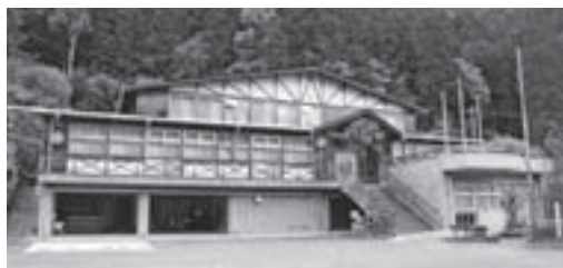
△「汗見川清流館」廃校となった小学校を改修し宿泊施設として運営。

験ツアー」や夏場には、「高知・本山汗見川清流マラソン大会」を開催しています。そして平成20年からは、廃校となった学校施設を宿泊施設として、地域の活性化団体が主体となり運営を始め、農林業体験や地域食材の提供、交流事業の受入なども進めています。