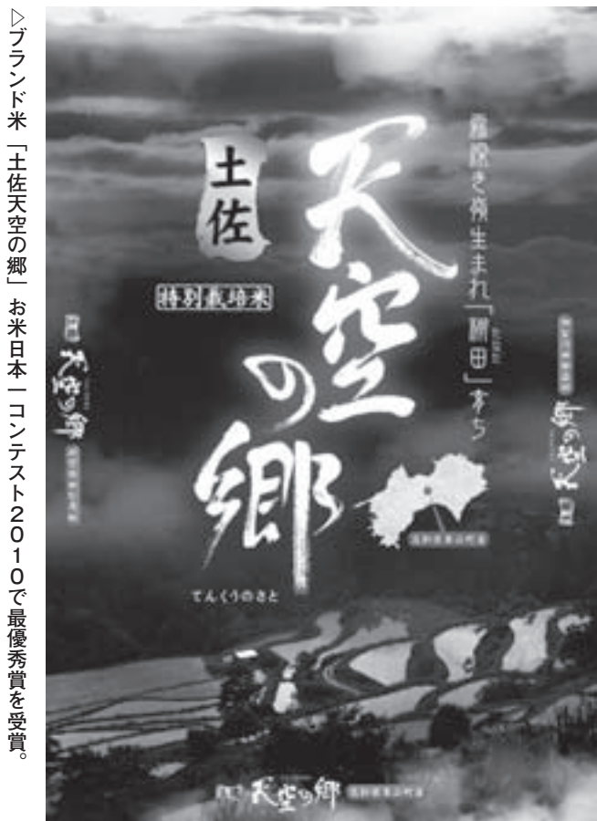
▶ブランド米「土佐天空の郷」お米日本一コンテスト2010で最優秀賞を受賞。

具体的な取り組みとしては、町内外の親子に参加してもらい「田んぼの生き物調査隊」を開催、多種多様な生態系を知ってもらうとともに安全安心なお米づくりが続けられていることが証明されました。さらに産業文化祭では魚沼産コシヒカリや長野県産ミルキークイーンなど有名産地と本山町産米の食べ比べを実施し、そのアンケート結果では本山町産が美味しいと答えた方が最も多く、生産者の自信にも繋がる結果となりました。