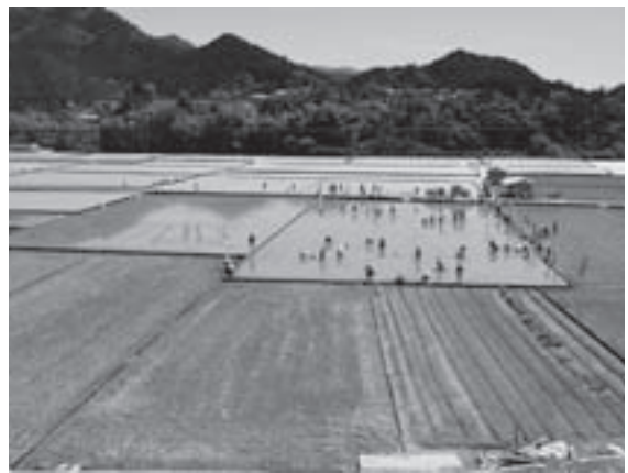
◁田んぼアート制作

全国から土佐天空の郷取扱店を招いた産地見学ツアーや水田の果たす役割やその大切さを子どもたちに伝える勉強会なども開催してきました。