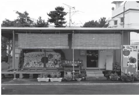
こじんまりしたプレハブの放送局ですが、町の情報がいっぱいつまっています

宮城県沿岸部に位置する山元町は、東日本大震災の大津波で全世帯のおよそ半数が被災しま