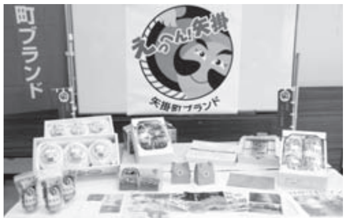
矢掛町ブランドに認定された特産品

加えて、電気自動車を早くから導入し、今年度は？地区ある公民館に1台ずつ三菱自動車の電気自動車ミープを