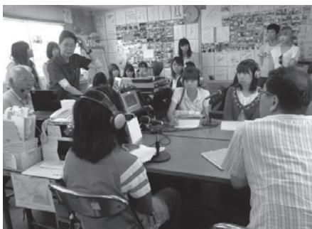
今も放送局内は、DJブースもないワンフロアでわきあいあいと

う人々のインタビューをそのまま放送したり、様々な職業の町民をゲストに招いてトークを展開したり。これまで各界の著名人もたくさんスタジオを訪れ、激励してくれました。また、町内のすべての学校や幼稚園を紹介する人気コーナーや町議会の完全生中継など、常に町民の関心が高い事柄を取り上げています。そして、今では、サイマルラジオ※として、やむを得ず町を離れた町民にも、町の「今」を伝えることができるようになりました。これからも、「いい町には声がある」のキャッチフレーズのように、りんごラジオを通して、町のありのままの「声」を「届けよう」として、本当の意味での町の復興を目指していきます。