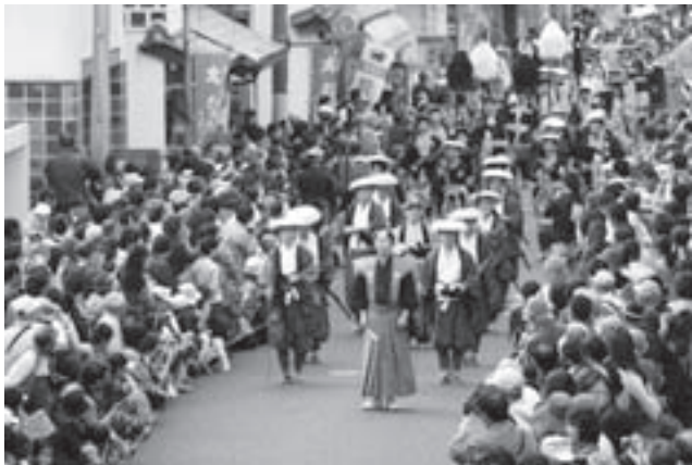
▷宿場まつり「大名行列」