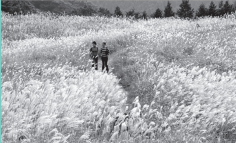
高原一面のススキ (奈良県曾爾村)