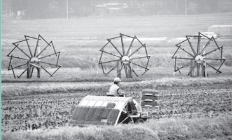
水車のある風景 (宮城県)