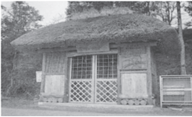
△遠野市宮代集落にある「茅葺屋根のごみ置き場」

象をターゲットにしてマーケティングするが、重要になってきている。そうした事業展開を専門的に担うべきは、個別実践者と行政の中間にある組織であろう。この中間支援機能を担う人材の確保とその持続可能な組織化が、日本のグリーン・ツーリズム実践の根幹的課題である。