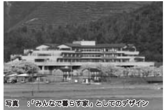
写真：「みんなで暮らす家」としてのデザイン