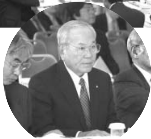
宮城全国町村会常任理事

教育関連3法案（学校教育法・教員免許法・地方教育行政法）については、安倍内閣が今国会での成立を目指しており、政府の教育再生会議の第1分科会が、去る2月5日に提言をまとめている。その内容は、教育委員会と教育長の役割・権限の明確化、教育委員会の第三者評価の実施、人口5万人以下市町村における教育委員会設置の弾力化、県費負担教職員の人事権の市町村への移譲、文部科学大臣による教育委員会への是正勧告など8項目。