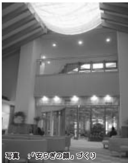
写真：「安らぎの顔」づくり

低層部の広い屋根面を利用し て、各病棟から安心して利用し き、見守りが必要 な患者さまが身近 に緑を感じたり、 軽い運動ができる 治療、療養の場と して、屋上庭園