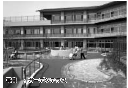
写真：ガーデンテラス