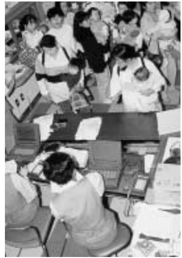
保健センターでの受付

三、福祉機能 福祉分野では、高齢者情報管理支援・施設利用情報管理支援・訪問活動支援といった分野で利用しております。