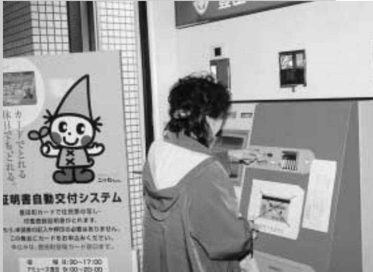
証明書自動交付機を利用する町民