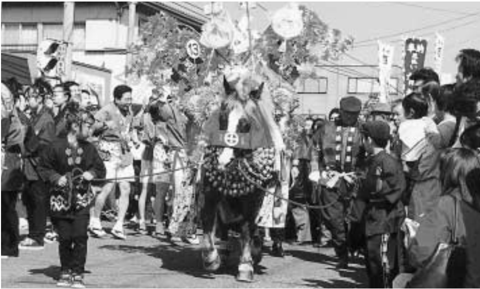
鹿児島島神宮・初午祭

発行所 全国町村会 〒100 0014 東京都千代田区永田町 1 丁目11番35号 : 電話03 3581 0486番 FAX03 3580 5955 発行人 渡辺 明 : 定価 1部40円・年間 1,500円( 税、送料含む ) 振替口座00110 8 47697 http://www.zck.or.jp