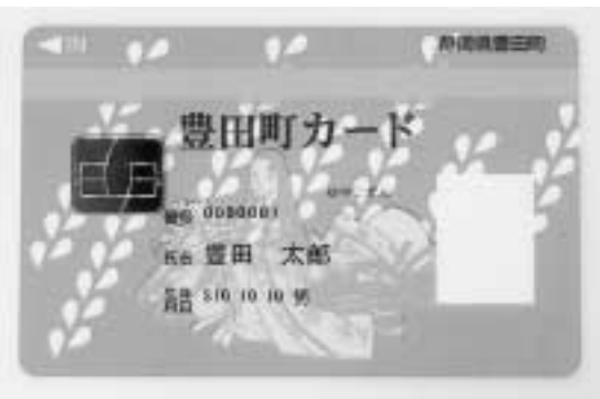
町民が携帯する地域カード

窓口での住民一人一人へのPR、相手の立場に立った利用方法の説明を繰り返すことが、カードの利用を増加させる近道であることが分かりました。