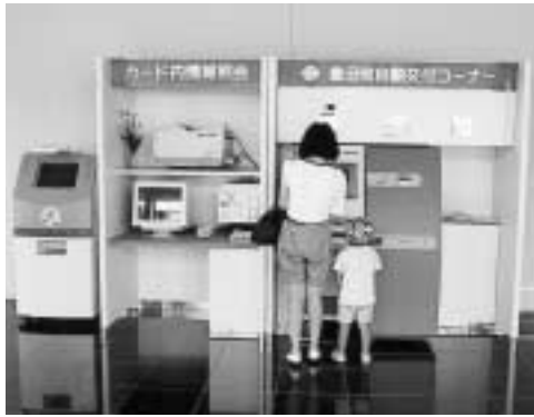
自動交付機(アミューズ豊田)

また、図書館カード機能としてこのカードを使って圖書の貸し出しが可能となっており、利用者も増加傾向にあります。