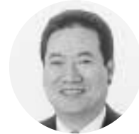
山 県 長 一 日 町 龍 富 魚 朝 津