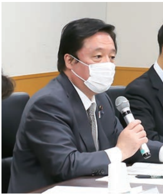
▲挨拶する若宮大臣

はじめに、若宮大臣が挨拶に立ち、地方が直面している少子高齢化等の諸課題の解決について、地方への人の流れを生み出すことがより重要であるとし、「今般のコロナ禍において、地方への移住やテレワークなど、国民の意識向上にも大きな変化の兆しが見られる中、地方からデジタル