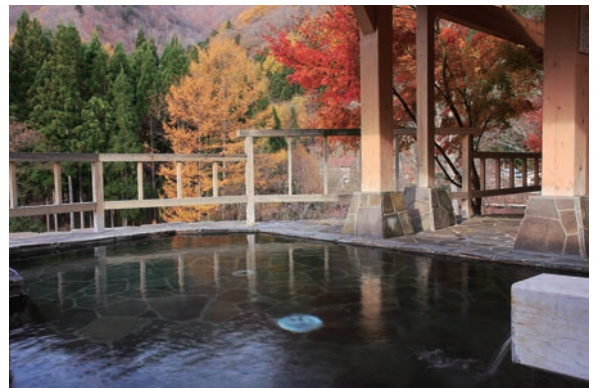
▲尾瀬檜枝岐温泉「燵の湯」

このように尾瀬への訪問者は減少を続けておりますが、平成29年にオープンした道の駅「尾瀬檜枝岐」などを目的とした村内への旅行者は、コロナ禍にもかかわらず横ばいの数値が続いています。キャンプや車中泊など宿泊形態の多様化により、施設への宿泊者は減少しておりますが、この小さな村の観光は熱心な「檜枝岐ファン」によって長年支えられていると考えられます。