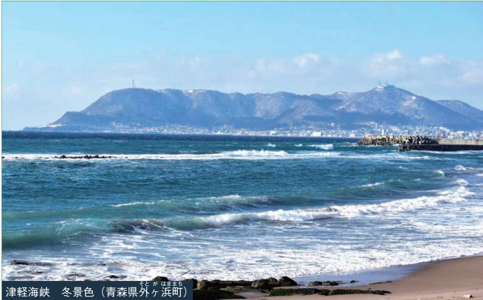
津軽海峡 冬景色 (青森県外ヶ浜町)