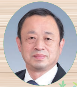
はなもと やすし 徳島県上勝町長 花 本 靖