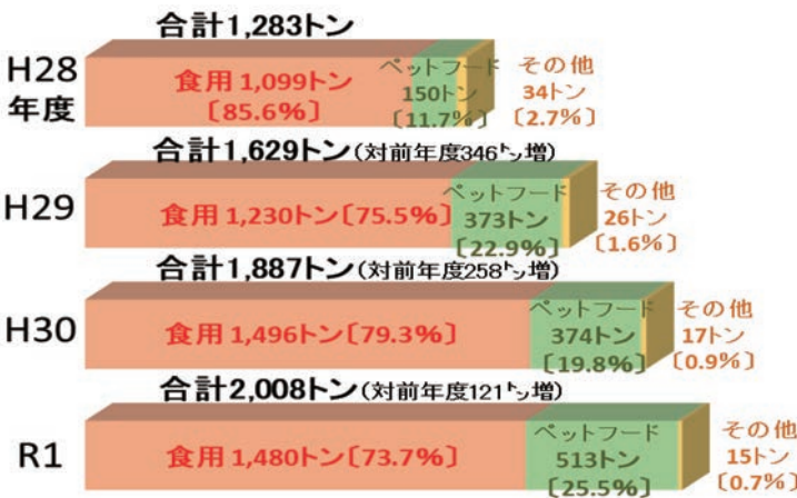
図4 ジビエ利用量及び内訳の推移

③捕獲等の技術の高度化等のための技術開発の成果の普及(法第14条) 被害防止対策の担い手の減少・高齢化が進展する中、被害防止活動の省力化や効率化のための新しい技術の普及を図っていくことが必要となっている。特に、情報通信技術を活用したわなや、センサーを用いた鳥獣の監視技術等について、現場での活用事例が蓄積しつつある。 こうした状況を踏まえ、国及び都道府県は、捕獲等の技術の高度化等のための技術開発の推進に加えて、その成果の普及を行うこととされた。 (3)捕獲等をした鳥獣の適正な処理・有効利用のための措置の拡充 ①適正な処理のための措置(法第10条) 捕獲者の高齢化、地域的な捕獲の増加等により捕獲した個体の処理作業が負担となっている地域がある。一方、近年、近隣市町村が連携した広域的な処理や、減容化施設の整備等による効率的な処理について、取組事例が蓄積しつつあるところである。 こうした状況を踏まえ、国