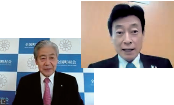
▲西村大臣(右)に要請

全国町村会は、「全国的な感染急拡大への対応に関する緊急要望(別添参照)をとりまとめ、9月8日、9日、荒木泰臣会長(熊本県嘉島町長)が坂本哲志地方創生担当大臣、大島一博厚生労働省大臣官房長に対して要請活動を行った。 また、15日には西村康稔経済再生担当大臣とWeb会議形式による要請を行った。西村大臣は「町村部は医療体制が脆弱なところもあるた