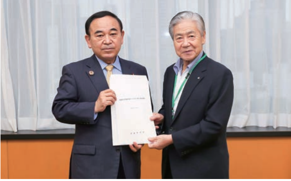
▲坂本大臣(左)に要請する荒木会長(右)

全国町村会は、「全国的な感染急拡大への対応に関する緊急要望(別添参照)をとりまとめ、9月8日、9日、荒木泰臣会長(熊本県嘉島町長)が坂本哲志地方創生担当大臣、大島一博厚生労働省大臣官房長に対して要請活動を行った。 また、15日には西村康稔経済再生担当大臣とWeb会議形式による要請を行った。西村大臣は「町村部は医療体制が脆弱なところもあるた