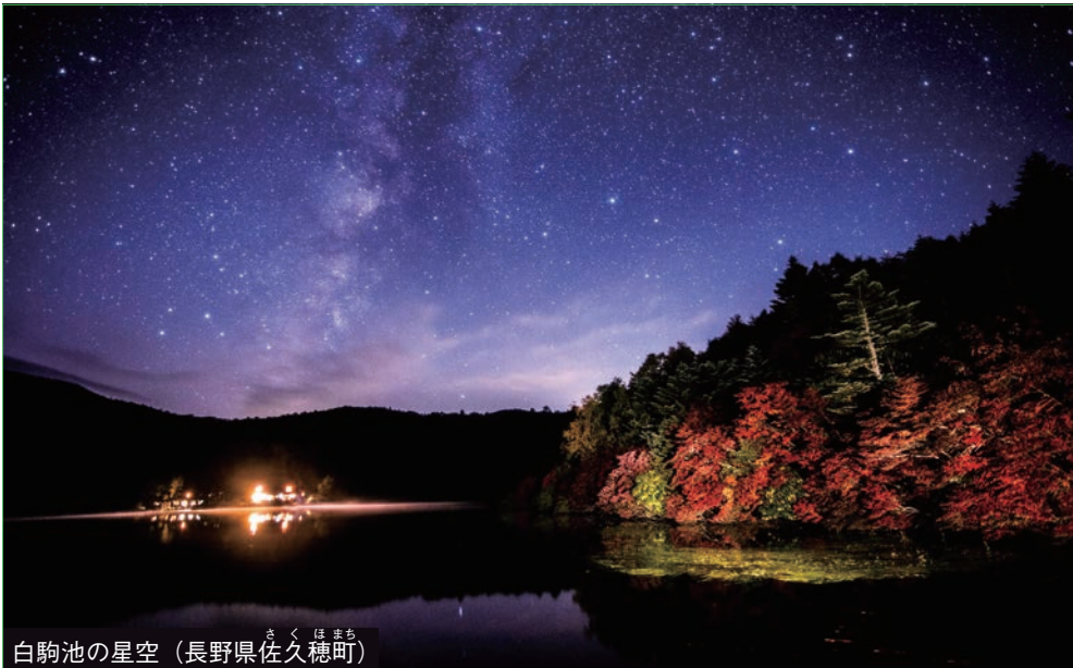
白駒池の星空(長野県佐久穂町)