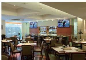
レストラン「ペルラン」

全国町村会館には、 会議室・宴会場のほかに、 ふたつのレストランもございます。 お気軽にお立ち寄りください。