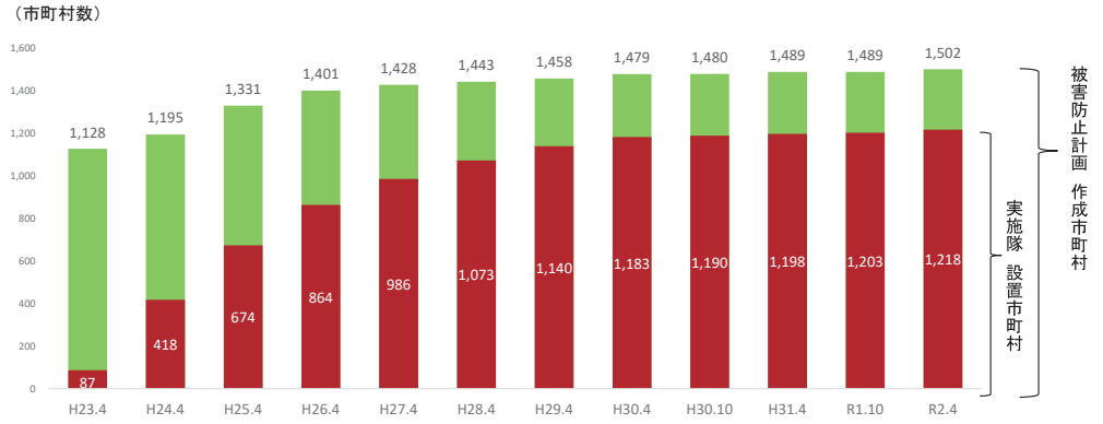
図3 被害防止計画策定市町村数・実施隊設置市町村数の推移

今後、各市町村において、農林漁業者や関係団体職員、地域住民の方等、多様な主体の対策への参画を促し、実施隊の機能強化を進めていく