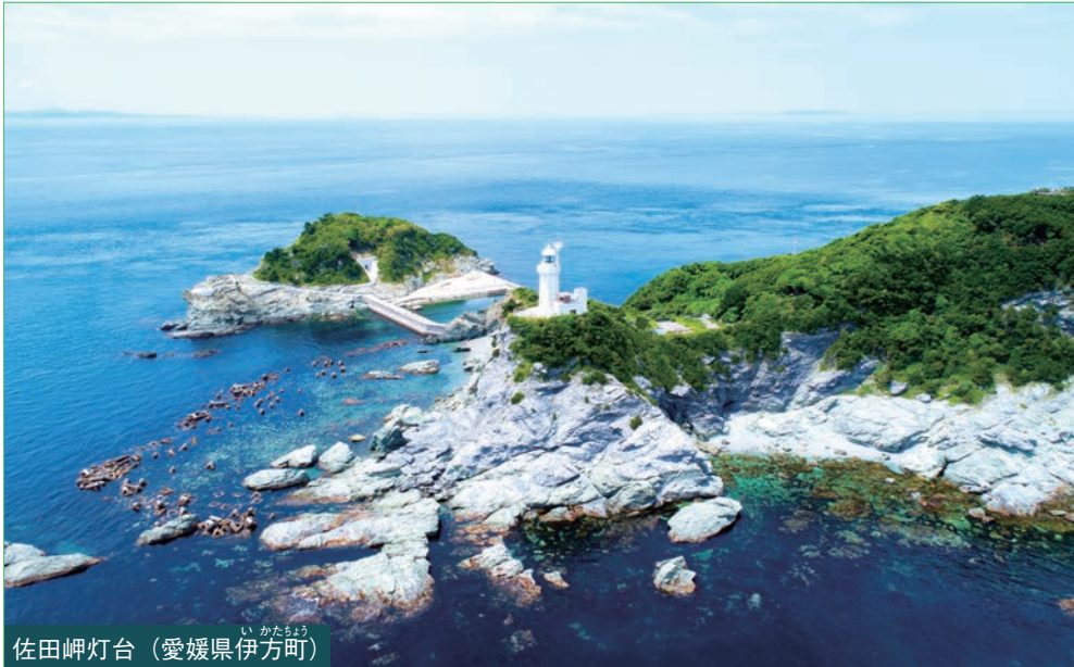
佐田岬灯台 (愛媛県伊方町)