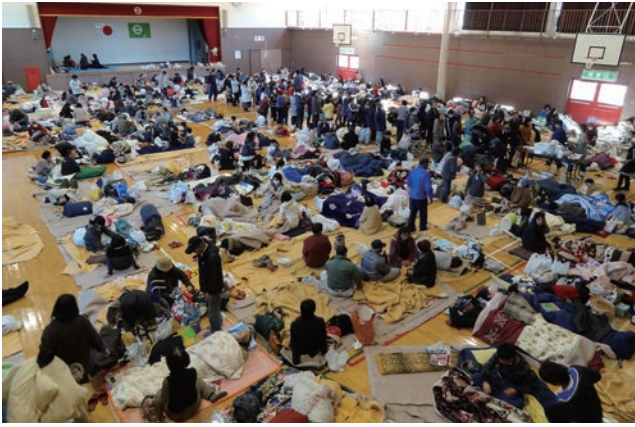
川内村村民体育センター避難所

長期の避難生活による影響は計り知れないものがありました。体調を崩す村民が続出し、特に高齢者においては入院や要介護度の重症化に伴う施設入