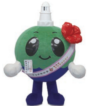
鹿児島県南大隅町

佐多岬のハイビスカスが海中に落ちて、サンゴの精霊が宿って誕生。動きもゆるゆるののんびり屋さんだが、ごう見えて走れてジャンプも得意。佐多岬周辺でフカフカ漂うのが趣味。楽塩ソフトクリームとウツボの唐揚げが好物。