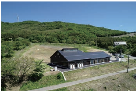
令和3年5月に完成した「かわうちワイナリー」