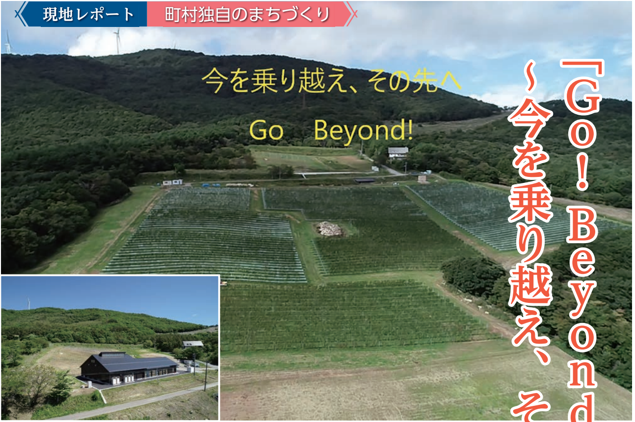
ワイン用ぶどう畑「高田島ワイナード」