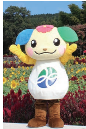
みやき町イメージキャラクター

2015年3月19日生まれ。何事にも一生懸命で、人懐っこい。特技は誰とでも仲良くなれること。病院を訪問したり、役場の仕事を手伝ったりと色々な働き者。